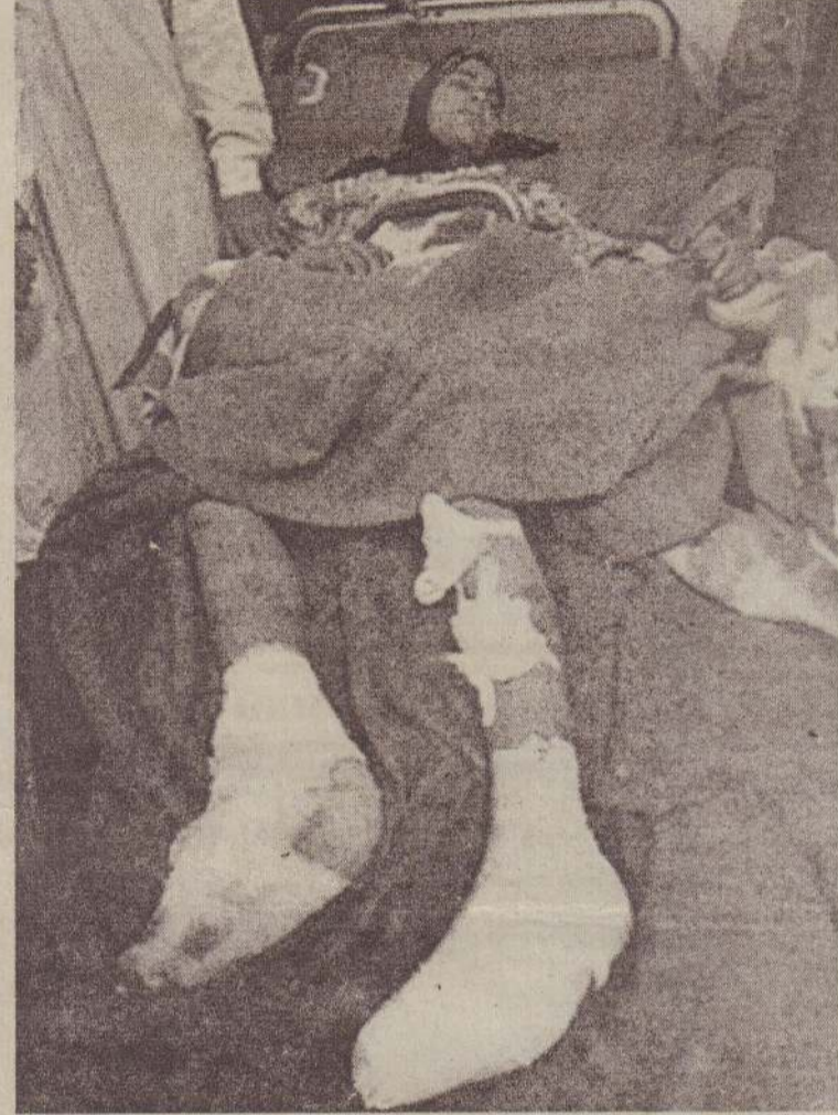
அமெரிக்க விமானத் தாக்குதலில் காயமடைந்து பக்தாத் மருத்துவமனையில் சிகிச்சைபெற்றுவரும் ஈராக்கிய பெண்மணி.