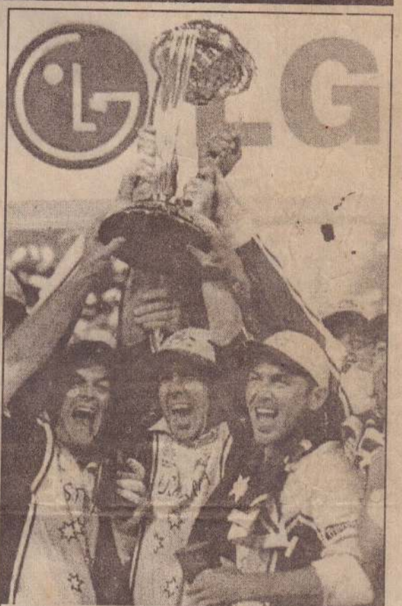
முன்றாவது தடவையாக கிரிக்கெட் உலகக் கிண்ணத்தை வென்று சாதனை படைத்துள்ள சா ஆஸ்திரேலியா. இந்தியாவை 125 ஓட்டங்களால் 6-1 று அடி வென்றது. கண்ணத்துடன் ஆல். அணியினர்.