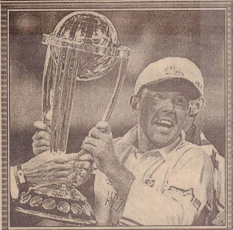
பிரவுன்ஸ் எலக்ட்ரானிக்ஸ் BROWNS ELECTRONICS