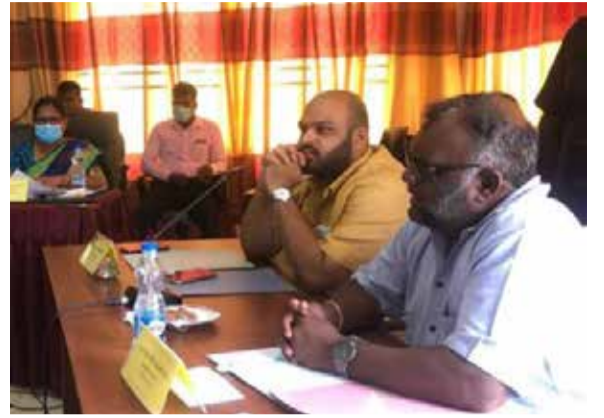
எடுக்கப்பட்டதுடன், மாவட்ட அபிவிருத்தி குழுவின் தீர்மானம் எடுப்பதற்காக அது அனுப்பிவைக்கப்படவுள்ளது.

இந்நிலையில் அபிவிருத்திக்குழுவின் இணைத் தலைவரும் இராஜாங்க அமைச்சருமான எஸ்.வியாழேந்திரனும் இவர்களின் எதிர்ப்பு அடங்கிய தீர்மானத்தை ஏற்றுக்கொண்டிருந்தமையுடன், பிரதேச அபிவிருத்தி குழுக் கூட்டத்தில் ஏகமனதாக தீர்மானம்