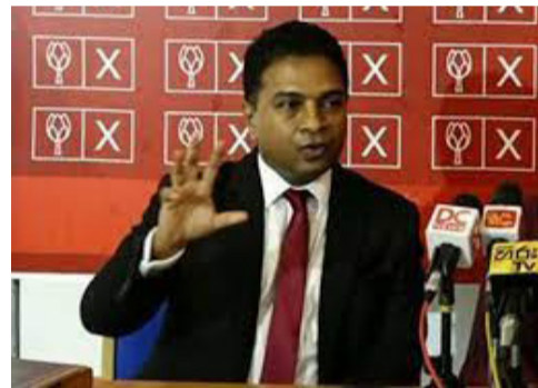
கொழும்பு, மார்ச் 16

நாட்டு மக்களுக்கு வழங்கிய வாக்குறுதிகளை சிறந்த முறையில் நிறைவேற்றியுள்ளோம். அரசாங்கத்துக்கு எதிராக எதிர்த்தரப்பினர் முன்வைக்கும் குற்றச்சாட்டுக்கள் தொடர்பாக நாட்டு மக்கள் புத்திசாலித்தனமானதாக ஆராய வேண்டும் என பொதுஜன பெரமுனவின் பொதுச்செயலாளர் சாகர காரியவசம் தெரிவித்தார்.