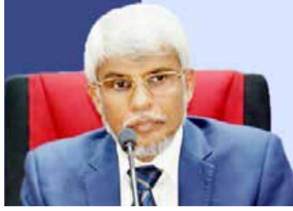
உணர்ச்சிவசமாக மக்களைத் தூண்டி விட்டு வீதியில் நின்று கூச்சல் போடும் கலாசாரத்தால் எதனையும்