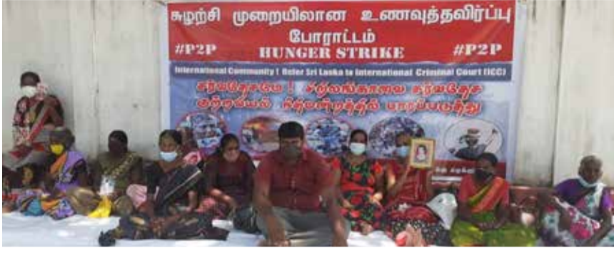
மட்டக்களப்புமாமாங்கப்பிள்ளையார் களுக்கு மத்தியில் நடைபெறும் உணவு ஒறுப்புக்கு முன்னால் பல அச்சுறுத்தல் ணாவிதப் போராட்டத்தை முடக்கும்

நோக்கில் நேற்றுமீட்டர் மோட்டார் சைக்கிளில் வந்த பொலிஸார் போராட்டக்காரர்களின் பெயர்களை கேட்டு அச்சுறுத்தும் வகையில் செயற்பட்டனர்.