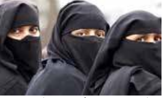
இலங்கையில் பொது இடங்களில் முகத்தை மறைக்கும் புர்கா

அணிவதைத் தடை செய்வது தொடர்பாக தொடர்ந்தும் கலந்துரையாட்டுவருகின்றது என அமைச்சரவை பேச்சாளரான அமைச்சர் கெஹலிய ரம்புக்வெல தெரிவித்தார்.