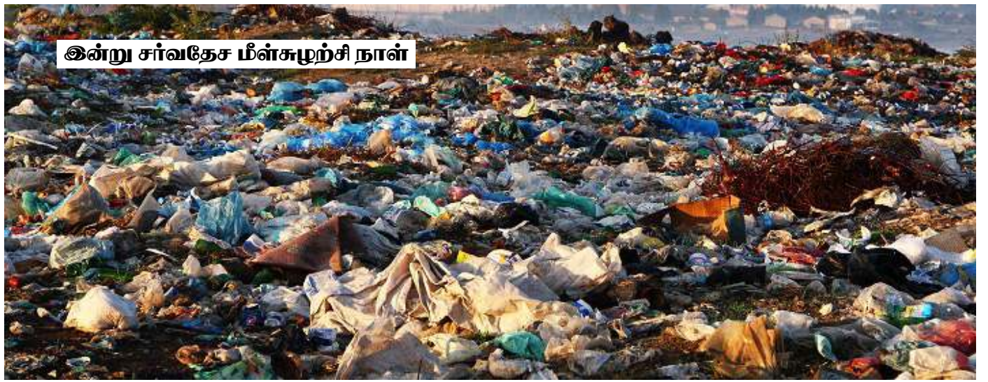
இன்று சர்வதேச மீள்சுழற்சி நாள்