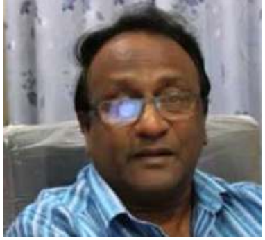
பாகிஸ்தான் அரசின் தேவைக்

கேற்ப இலங்கையில் தீர்மானங்களை மேற்கொள்ள முடியாது.