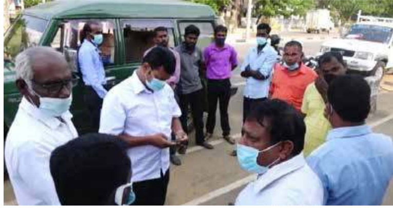
கையை நிறுத்துமாறும் தெரிவிக்கப்பட்டது. இது தொடர்பாக, எழுத்து

சென்றிருந்த நில அளவையாளர்கள், அளவீட்டுக்கான நடவடிக்கைகளை முன்னெடுத்திருந்தனர். இந்நிலையில், அப்பகுதிக்கு விரைந்த காணியை உரிமையாளர்கள் என தம்மை அடையாளப்படுத்தியவர்கள் மற்றும் அரசியல்வாதிகளின் தலையீட்டை அடுத்து அளவீட்டு நடவடிக்கை தற்காலிகமாக இடைநிறுத்தப்பட்டுள்ளன. குறித்த காணியை தனியாருடையது எனவும் அதன் உரிமையாளர்கள் வெளிநாடுகளில் உள்ளனர் எனவும் அவர்கள் வருகை தரும்வரை காணியை அளவீடு செய்யும் நடவடிக்கை