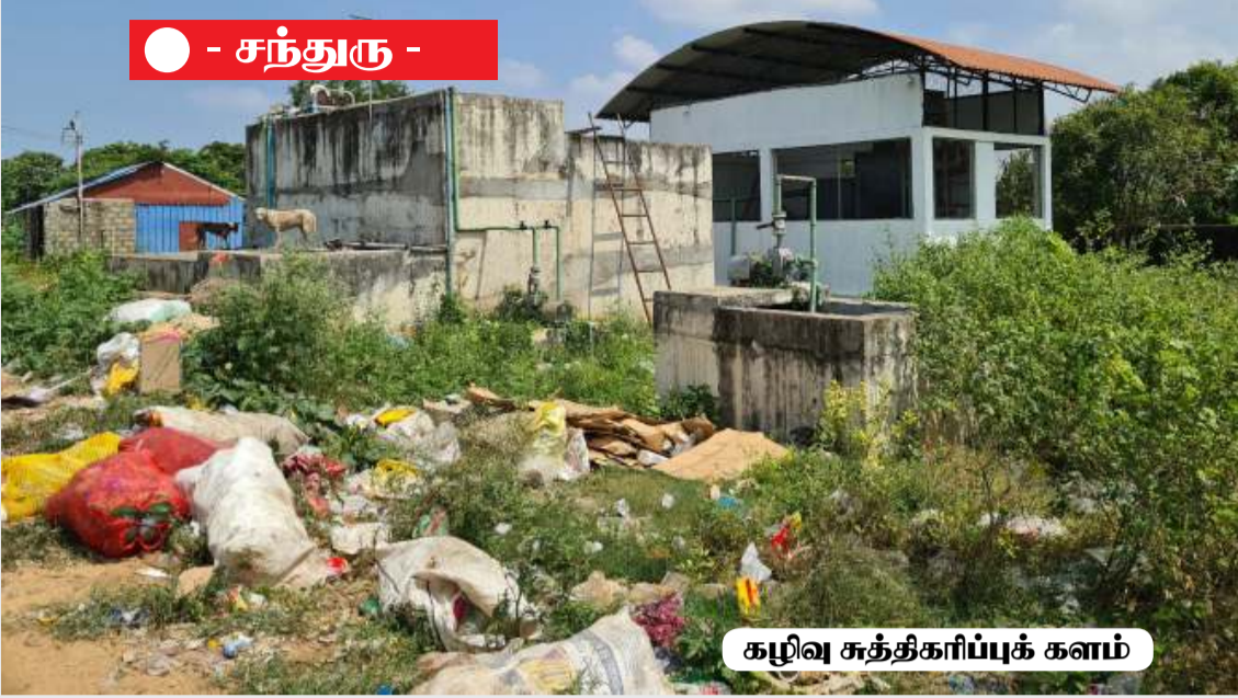
கழிவு சுத்திகரிப்புக் களம்