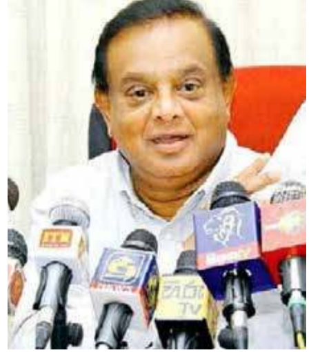
அமைச்சுக்கு அறிக்கை சமர்ப்பிக்குமாறு பணிக்கப்பட்டுள்ளன அறிக்கை நாடாளுமன்றில் சமர்ப்பிக்கப்படும். - என்றார்.

காடழிப்பு குறித்து பல குற்றச்சாட்டுக்கள் இதுவரையில் முன்வைக்கப்பட்டுள்ளன அந்தக் குற்றச்சாட்டுக்கள் தொடர்பில் விசாரணை நடவடிக்கைகளை முன்னெடுத்து வனஜீவராசிகள்