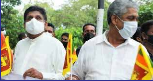
ளில், சுற்றுடல் பாதுகாப்பை வலியுறுத்தி மக்கள் விடுதலை முன்னணி பாரிய ஆர்ப்பாட்டமொன்றை கடந்த திங்கட்கிழமை முன்னெடுத்திருந்தமை குறிப்பிடத்தக்கது.

இதேவேளை உயிர்ப்புச்சகாப்பாற்றிக்கொள்ள கொழும்பிற்கு வாருங்கள் என்ற தொனிப்பொரு