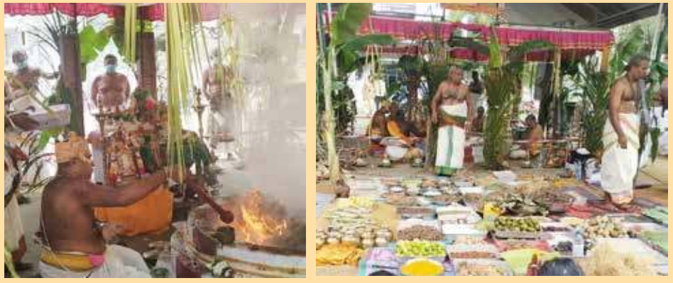
யாழ்ப்பாணம் - வண்ணை, மணிக்கூட்டு வீதி அருள் மிகு ஸ்ரீ அரசடி விநாயகர் தேவஸ்தான மகா கணபதி ஹோமப் பெரு விழா நேற்றையதினம் வெகு சிறப்பாக இவ்விதே நடைபெற்றது.

பொலிஸார் இது தொடர்பிலும் கண்காணிப்புக்களை முன்னெடுத்து வருகின்றனர். சுற்றுச்சூழலுக்கு பாதிப்பை ஏற்படுத்துபவர்களுக்கு எதிராக கடும் சட்ட நடவடிக்கை எடுக்கப்படும். - என்றார்.