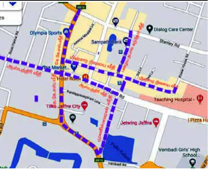
— நகரத்தில் முடக்கப்பட்ட பகுதிகளின் எல்லை.