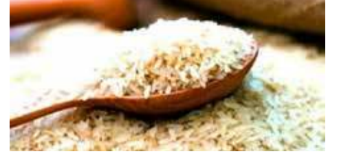
கூட்டுறவு விற்பனை நிலையங்கள் மற்றும் சுப்பர் மார்க்கெட்டுக்களில் மேற்படி விலைகளில் அரிசியைக் கொள்வனவு செய்யமுடியும் எனவும் அறிவிக்கப்பட்டுள்ளது. (ஏ)