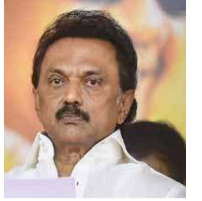
அவர் களின் எண்ணம் ஈடேறாத வகையில், கவனத்துடன் சொற்களைப் பயன்படுத்த வேண்டும் என்று ஸ்டாலின் கூறியுள்ளார். (ஐ)

பிரசாரத்தின்போது உணர்ச்சி வசப்பட்டு, கண்ணியக் குறைவான சொற்களை வெளிப்படுத்தக் கூடாது. அப்படிப்பட்ட சொற்கள் உதிர்த்திடுவதைக் கண்டிப்பாகத் தவிர்த்திட வேண்டும். அத்தகைய பேச்சுகளைத் தி.மு.க. தலைமை ஒருபோதும் ஏற்காது. தி.மு.க. கூட்டணியின் வெற்றி உறுதியாகவும் வலிமையாகவும் மக்களால் தீர்மானிக்கப்பட்டு விட்ட நிலையில், தி.மு.கவினர் பேச்சுகளைத் திரித்து, வெட்டி-ஒட்டி, தவறான பொருள்படும் படி செய்து மேற்கொண்டிருக்கிறார்கள்.