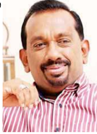
விலை எம்மால்தான் தீர்மானிக்கப்படும்- என்றார். (எ)

நுகர்வோருக்கு அரிசியைப் பெற்றுக் கொடுக்க முடியாது. எம்மிடம் தற்போது 50 ஆயிரம் மெட்ரிக் தொன் நெல் உள்ளது. 2 மில்லியன் மெட்ரிக் தொன் அரிசி இருப்பே தற்போதைய எமது இலக்கு. நாம் 20 இலட்சம் இருப்பினை அடைந்த பின்னர் ஆலை உரிமையாளர்களுக்கு ஆட முடியாது. நாட்டின் அரிசி