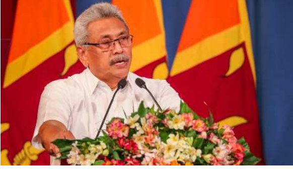
தனிநபர்களை அல்லாது அரசாங்கத்தின் கொள்கைகளை முன்னிலைப்படுத்த அனைவரும் உறுதியாக இருக்க வேண்டும் என ஜனாதிபதி கோட்டாபய ராஜ