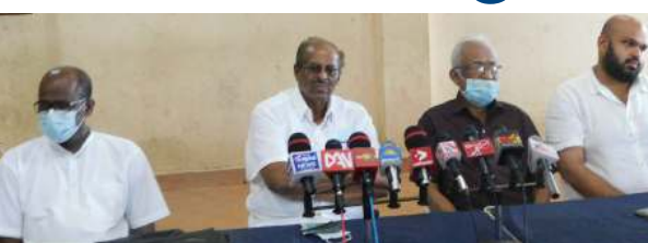
அம்பாறை, மார்ச் 30

இலங்கை தமிழரசு கட்சியின் கல்முனை தொகுதி பிரதேசத்திற்கான பிரதேச சபை உறுப்பினர்கள் மற்றும் கட்சியின் பிரதானிகளுடன் நேற்று இரவு அம்பாறை