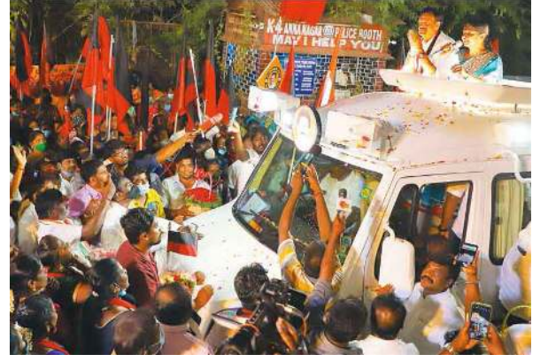
களுக்கு எதிரானது. இந்தச் சட்டத்திற்கு ஆதரவாக அ.தி.மு.க. வாக்களித்தது. ஆனால், இப்போது இந்தச் சட்டத்தை இரத்துச் செய்வதற்கு அழுத்தம் கொடுப்போம் எனப் பேசுகிறார்கள் எனக் குறிப்பிட்டார்.

விருகம்பாக்கத்தில் இடம்பெற்ற பிரசாரக் கூட்டத்தில் கலந்துகொண்டு கருத்து உரையாற்றியபோதே அவர் இவ்வாறு குறிப்பிட்டுள்ளார். தொடர்ந்து அங்கு பேசிய அவர், அ.தி.மு.க. ஆட்சியில் அதிகம் பாதிக்கப்பட்டிருப்பது பெண்கள் தான். அவர்களின் ஆட்சியில் பெண்களுக்குப் பாதுகாப்பு இல்லை. பெண்களுக்கு எதிரான குற்றங்களில் ஈடுபடுபவர்களில் 15 சதவீதமானவர்கள் கூட தண்டிக்கப்படுவது கிடையாது. தி.மு.க. ஆட்சிக்கு வந்தவுடன் பெண்களுக்கு என் தனிநீதிமன்றம் அமைக்கப்படும். குடியரிமை திருத்தச் சட்டம் சிறப்பானமை மக்