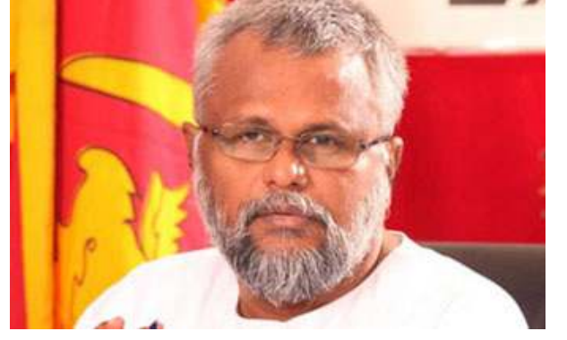
மீனவர்களுடனான சந்திப்பின் பின்னர் முடிவுகள் எடுக்கப்படும் என அவர் மேலும் தெரிவித்தார்.

எனினும் இந்த முடிவுகள் தொடர்பாக இருதரப்பு