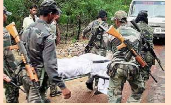
தேடுதல் நடவடிக்கையில் சுக்மாவில் என்கவுண்டர் நடந்த இடத்தில் 22 இராணுவ வீரர்களது உடல்கள் மீட்கப்பட்டுள்ளதாக பிந்திக் கிடைத்த தகவல்கள் தெரிவிக்கின்றன.

பதுங்கிருந்த நக்சல்கள் திடீரென நடத்திய துப்பாக்கிச் சூட்டில், சில வீரர்களை இழந்திருக்கிறோம். சில வீரர்கள் காயமடைந்துள்ளனர். அவர்கள் மீட்கப்பட்டு, மருத்துவமனையில் சேர்க்கப்பட்டனர். தாக்குதல் நடத்திய நக்சலைட்டுகள் தப்பிவிட்டனர். அவர்களைத் தேடும் பணி முடுக்கி விடப்பட்டுள்ளது" - என்று தெரிவித்தார். இந்த நிலையில், சட்டெஸ்கார் மாநிலத்தில் நக்சல்கள் நடத்திய தாக்குதலில் 7 சி.ஆர்.பி.எப். வீரர்கள் உட்பட 21 ஜவான்கள் காணவில்லை என அம்மாநில காவல் துறைத் தரப்பில் இன்று காலை தெரிவிக்கப்பட்டது. இதனிடையே இந்தத் தாக்குதலில் 15 சி.ஆர்.பி.எப். வீரர்கள் உட்பட 30 ஜவான்கள் காயம் அடைந்துள்ளனர் என்றும் அவர்களில் 23 பேர் பிஜப்பூர் மருத்துவமனையிலும் 7 பேர் ராய்ப்பூர் மருத்துவமனையிலும் அனுமதிக்கப்பட்டுள்ளதாகவும் தகவல்கள் கிடைத்துள்ளன. இந்தத் தாக்குதல்களைத் தொடர்ந்து நடத்தப்பட்ட