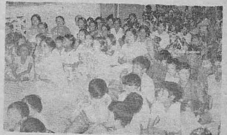
கொள்ளுப்பிட்டி ஸ்ரீ சக்ய சாயிபாபா பஜன் மண்டலியினர் நடத்திய சாயி பஜனையில் கலந்துகொண்ட சாயி பக்தர்கள்.

விழிப்படைந்தாள்! கதறினாள்! இக்கண்ணாடியில் வடிவில்லாத ஒரு பெண்மணியின் முகம் தென்பட்டது. உடனே அவள் கிக்குவைச் சந்தேகித்தாள். இப்பெண்ணைத் தன் கணவன் நேசித்திருக்கின்ற நோக்கத்துடன், தனது கணவனோடு தொடர்ந்து சண்டையிட்டாள். வீட்டில் அமைதியின்மை நிலவியது, ஒரு நாள் இப்படிச் சண்டை நடந்துக் கொண்டிருக்கும் பொழுது ஒரு மதகு அல்லவழியே சென்றுக்கொண்டிருந்தார். குழப்பம் நடந்து கொண்டிருக்கும் இடத்துக்குச் சென்று வினவினார். குழப்பத்தின் காரணத்தையும் அறிந்தார். உடனே அக்கண்ணாடி எங்கே என்று கேட்டு, தானும் அதை உற்று நோக்கினார். வியப்படைந்தார். கிக்குவையும், வில்லியையும் பார்த்து "இவ்வருவத்தை இருவரும் பிழையாகக் கருதுகிறீர்கள்." கிக்கு கூறுவது போல், இக்கண்ணாடியில் கிக்குவின் தகப்பனின் உருவம் தெரியவில்லை. வில்லி சொல்வது போல் ஒரு பெண்ணின் உருவமும் தெரியவில்லை. இக்கண்ணாடியில் மதகுருவின் உருவம் தான் தெரிகிறது. ஆகையால் நீங்கள் இருவரும் சண்டையை நிறுத்தி சந்தோஷமாக வாழுங்கள் என்று கூறி, அக்கண்ணாடியைக்கோயிலில் வைப்பதற்கு எடுத்துச் செல்கின்றார்.