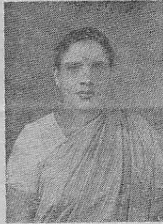
துர்க்கா துரந்தரி செல்வி. தங்கம்மா அப்பா குட்டி

நிரம்பிய தவத்தினை யுடையவர்கள் உணரும் வகையில் சிவபெருமான்