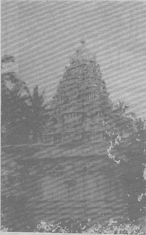
மாத்தளை ஸ்ரீ முத்துமாரியம்மன் ஆலயத்தின் முகப்புத் தோற்றம்.