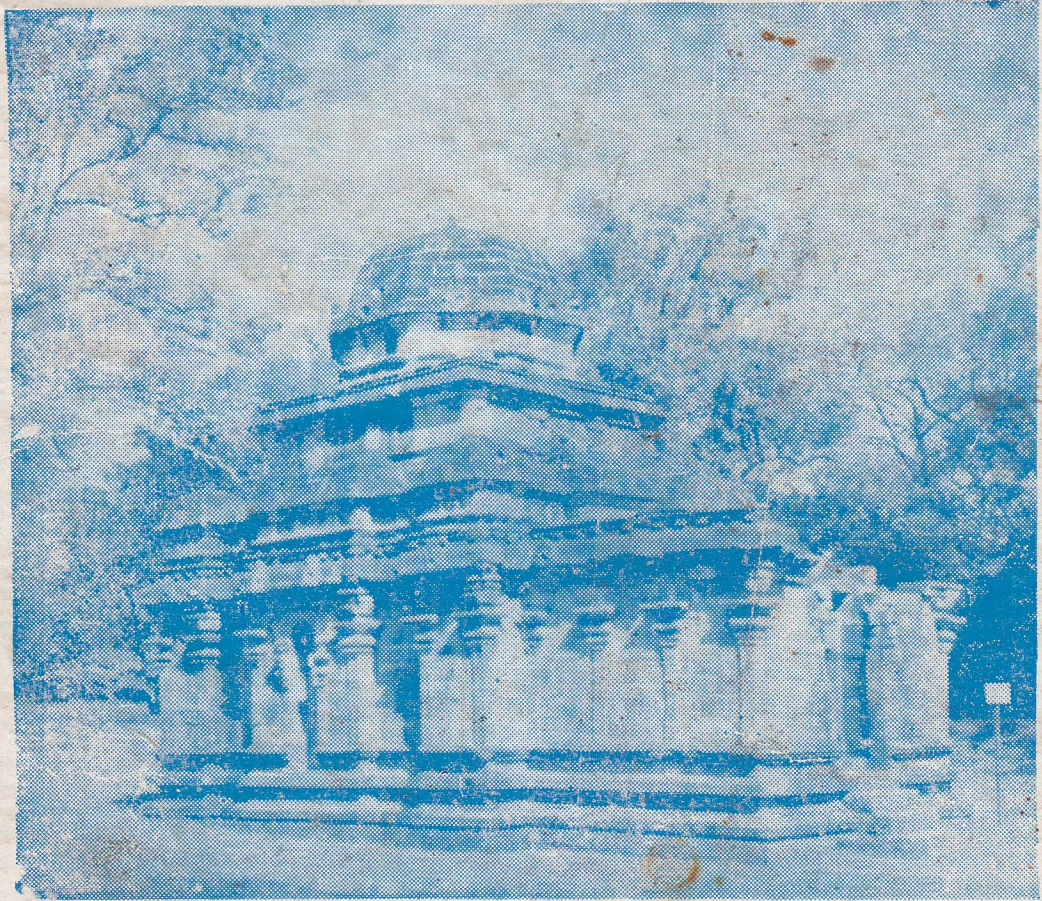
உபயம்: தொல்பெருட டிணக்களம், கொழும்பு.

எமது நாட்டிலுள்ள “பொலநறுவை” நகரம் சோழமன்னர் சாசனங்களிலே “புலநரி” என வழங்கப்பட்டிருக்கிறது. “புலஸ்தி நகரம்” எனவும் கூறப்படுவதுண்டு. இலங்கையிலே, சோழர் ஆட்சி நிலவிக்கொண்டிருந்த காலத்திலே, அம் மன்னர்கள் பொலநறுவையைத் தமது தலைநகராக்கி, அங்கே பல சிவாலயங்களையும் விட்டுணு வாலயங்களையும் அமைத்துக் கொண்டார்கள். அவர்கள் அமைத்த சிவாலயங்களுள் ஒன்று தான் மேலே காண்பது. அழிந்து கிடக்கின்றது.