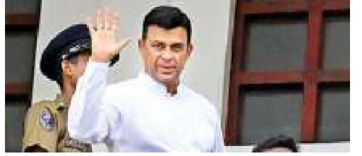
கொழும்பு, ஏப்ரல் 05

தனது நாடாளுமன்ற ஆசனம் இல்லாமல் செய்யப்படுவதைத் தடுக்கும் வகையில் எழுத்தாணை ஒன்றைப் பிறப்பிக்கும் மனு ரஞ்சன் ராமநாயக்க தாக்கல் செய்த ரிட் மனுவை மேன்முறையீட்டு நீதிமன்றம் இன்று நிராகரித்துள்ளது.