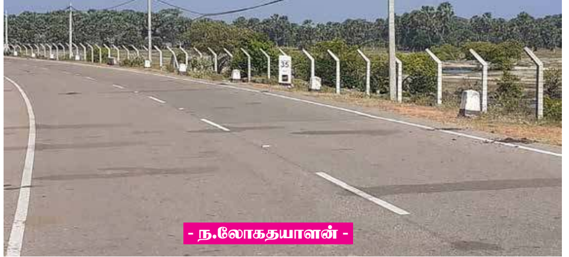
- ந.லோகதயாளன் -

முல்லைத்தீவு மாவட்டமானது 2 ஆயிரத்து 614 ச. கி. மீற்றர் பரப்பளவை உடைய 6 பிரதேச செயலாளர் பிரிவைக் கொண்ட மாவட்டம். அதாவது 2 லட்சத்து 69 ஆயிரத்து 300 ஹெக்டேயர் நிலமாகும். இதில் முல்லைத்தீவு மாவட்டத்தில் வனவளத்திணைக்களத்தின் ஆளுகையில் உள்ள பிரதேசம் மட்டும் ஒரு லட்சத்து 78 ஆயிரத்து 721 ஹெக்டேயர். இது மாவட்டத்தின் மொத்த நிலத்தின் 66.37 வீதமாகும். இங்கே எஞ்சியுள்ள 34 வீத நிலத்தில் 13 வீதமான நிலம் அதாவது 35 ஆயிரத்து 403 ஏக்கர் வயல் நிலமாகவுள்ளது. 4.6 வீதமான நிலம் சதுப்பு நில