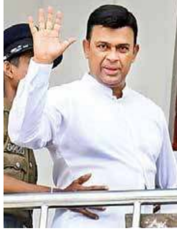
அறிவித்தார். இதனையடுத்து பாராளுமன்றத்தில் பெரும் குழப்பம் ஏற்பட்டது.

இந்நிலையிலேயே ஐக்கிய மக்கள் சக்தியின் கம்பஹா மாவட்ட எம்.பி.யான ரஞ்சன் ராமநாயக்கவின் பாராளுமன்ற உறுப்பினர் பதவி வெற்றிடமாகியுள்ளதாக சபாநாயகர் மஹிந்த யாப்பா அபேவர்த்தன நேற்று சபையில்