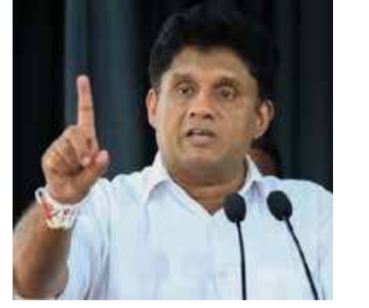
பாராளுமன்றம் அன்று அவரை அனுமதிக்க முடியாது என்றும் கூறப்பட்டிருந்தது.

கொழும்பு, ஏப். 08 ரஞ்சன் ராமநாயக்கவின் பாராளுமன்ற உறுப்பினர் விவகாரம் தொடர்பாக சபாநாயகர் மனிதத் தன்மையுடன் செயற்படவேண்டும் என எதிர்க்கட்சித் தலைவர் சஜித் பிரேமதாஸ கேட்டுள்ளார்.