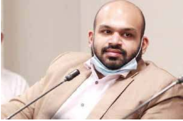
கொழும்பு, ஏப். 08

சீன ஆக்கிரமிப்பினால் எதிர்காலத்தில் சிங்கள சமூகத்திற்கு இடையிலேயே கிளர்ச்சியொன்று உருவாகும் என தமிழ்த் தேசியக் கூட்டமைப்பின் மட்டக்களப்பு