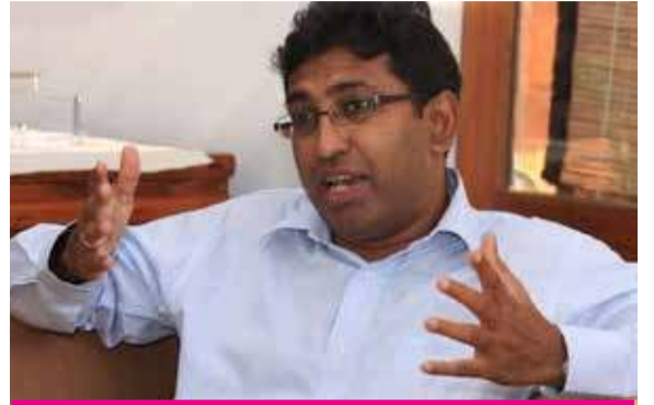
ஹர்ஷ டி சில்வா குற்றச்சாட்டு

இதன் மூலம் சகலருக்கும் தீர்வு கிடைக்கப்பெறாது. அத்தோடு கடந்த 2014 ஆம் ஆண்டு அன்றைய ஜனாதிபதி மஹிந்த ராஜபக்ஷவே பாம் எண்ணெய் உற்பத்தியை ஊக்குவித்தார்.