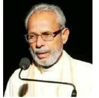
தண்டப்பணம் அறவிட மாநகரசபையினால் தண்டப்பணம் அறவிட முடியாது - என்றும் கூறினார். (ஐ)

மேற்கண்டவாறு தெரிவித்தார். கொழும்பு மாநகரசபையினால் உருவாக்கப்பட்ட ஆளணி, மாநகர சபை வாகன நிறுத்துமிடங்களில் பணம் அறவிடவே மாத்திரமே. ஆனால், யாழ் மாநகரசபை உருவாக்கியது