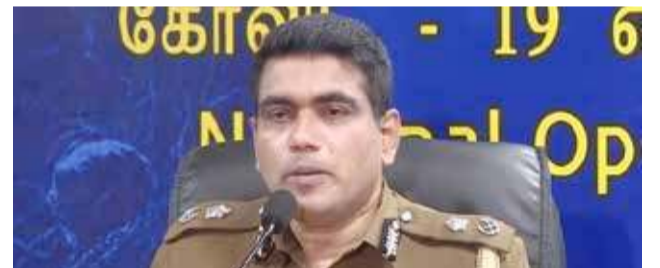
என்றும் அவர் சாடினார்.

ஆனால், இந்த யாழ்ப்பாணம் மாநகர காவல் பிரிவு முற்றிலும் நகரசபை நடவடிக்கைகளை ஒழுங்குபடுத்துவதாகவே அமைந்திருந்தது. இருப்பினும், அதற்கும் தற்போது புலிச்சாயம் பூசப்பட்டிருப்பது வடக்கு-கிழக்கு மக்கள் மீதான சந்தேக பார்வை அரசிடமிருந்து முற்றிலுமாக விடுபடவில்லையென்பதையே எடுத்துக்காட்டுவதாக இருக்கின்றது.