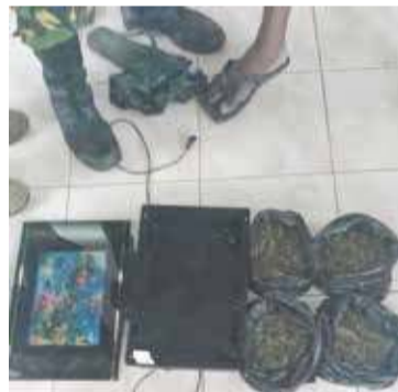
கிளிநொச்சி, ஏப். 12 கிளிநொச்சியில் பஸ்ஸில் கஞ்சா கடத்த முற்பட்ட ஒருவரை நேற்று பிற்பகல் தாம்

கைது செய்துள்ளனர் என்று கிளிநொச்சி பொலிஸார் தெரிவித்தனர்.