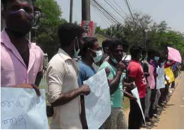
மட்டக்களப்பு கோறளைப்பற்று கிண்ணையடி கிராமத்தில் அமைக்கப்படும் மீன் பண்ணை மற்றும் மணல் அகழ்வை தடை செய்யக் கோரி நேற்று கவன

வீர்ப்பு போராட்டத்தில் மக்கள் ஈடுபட்டனர். மட்டக்களப்பு கிண்ணையடி பிரதான வீதியில் இருந்து ஆரம்பமான போராட்டமானது ஊர்வலமாக வந்து பிரதேச செயலகத்தினை வந்தடைந்தது. ஊர்வலத்தில் வந்தோர் வாசகங்கள் எழுதிய பதாதைகளை கையில் ஏந்தியவாறு கோஷங்களை எழுப்பியவாறு பிரதான வீதி வழியாக வாழைச்சேனையை வந்தடைந்தனர். அங்கு கூடியவர்கள் பிரதேச செயலகத்திற்கு முன்பாக நின்று கவனவீர்ப்பு போராட்டத்தில் ஈடுபட்டனர். இதன்போது மீன்வளர்ப்புத் திட்டத்தை ரத்துச் செய், எமது மண் எமக்கு வேண்டும். அள்ளாதே அள்ளாதே மணலை அள்ளாதே, என்ற கோஷங்களை எழுப்பினார்கள். பின்னர் பிரதேச செயலக வளவினுள் சென்று கோஷங்களை எழுப்பினர். உதவி பிரதேச செயலாளரிடம் தங்களது கோரிக்கை அடங்கிய மகஜரை சமர்ப்பித்தனர். மகஜரை வாசித்து அறிந்து கொண்ட உதவி பிரதேச