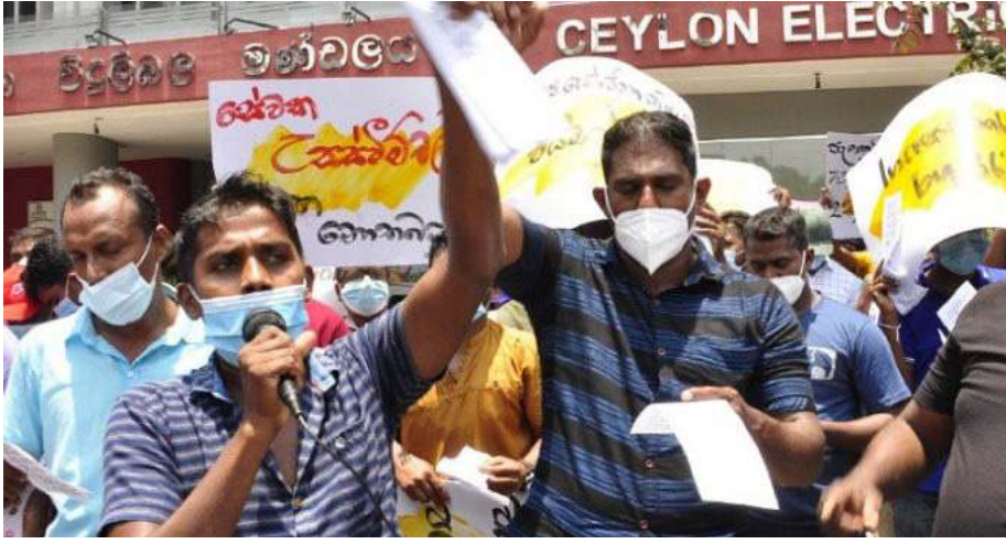
கொழும்பு, ஏப்ரல் 10 சம்பள முரண்பாடுகள் மற்றும் மூன்று

வருடங்களுக்கு ஒரு முறை வழங்கப்பட வேண்டிய 25 சதவீத சம்பள உயர்வு ஆகியவற்றைத் தீர்ப்பதற்கு உடனடி நடவடிக்கை மேற்கொள்ளுமாறு, அரசாங்கத்தை வலியுறுத்தி இலங்கை மின்சார சபை ஊழியர்கள் போராட்டமொன்றை முன்னெடுத்திருந்தனர்.