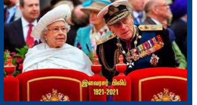
இளவரசர் பிலிப் 1921-2021

பிலிப், கடந்த பெப்ரவரி 6 ஆம் திகதி மருத்துவமனையில் அனுமதிக்கப்பட்டார். அவருக்கு ஏற்கனவே இருந்த இருதய நோய் மற்றும் நோய்த்தொற்றுக்காக சிகிச்சை பெற்று, வீடு திரும்பினார். இந்த நிலையில் நேற்று காலமாகியுள்ளார்.