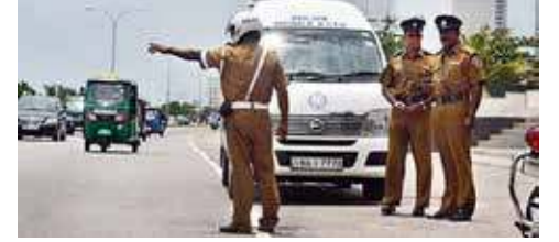
சித்திரைப் புத்தாண்டு வாரத்தை முன்னிட்டு, சகல பிரதேசங்களிலும் வாகன சாரதிகள் மீது விசேட கவனம்