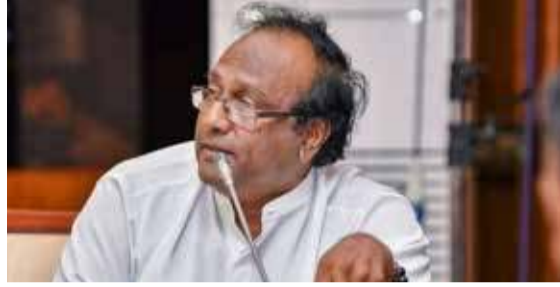
களில் ஈடுபடுவோரைத் தண்டிக்கும் வகையில் சட்டத் திருத்தங்கள் மேற்கொள்ளப்பட உள்ளன என அமைச்சர் சரத் வீரசேகர குறிப்பிட்டுள்ளார்.

இந்த நிலையில் மேலும் பல அமைப்புகள் மீதும், அதேபோல நாபர்களும் மீதும் தடை விதிக்கப்பட இருப்பதாக அமைச்சர் தெரிவித்தார்.