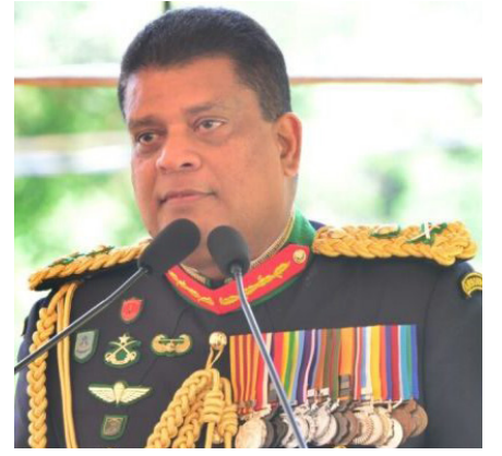
தகுந்த நடவடிக்கைகளை எடுப்போம்' எனத் தெரிவித்துள்ளார்.

பண்டிகைக் காலத்திற்குப்பின்னரான கொவிட் - 19 நிலைமை தொடர்பாகக் கருத்துத் தெரிவித்த இராணுவத் தளபதி - நிலைமையை அதிகாரிகள் உன்னிப்பாகக் கண்காணித்து வருகின்றனர் எனத் தெரிவித்தார். அடுத்த வரவிருக்கும் நாள்களில் நிலைமையைப் பொறுத்து