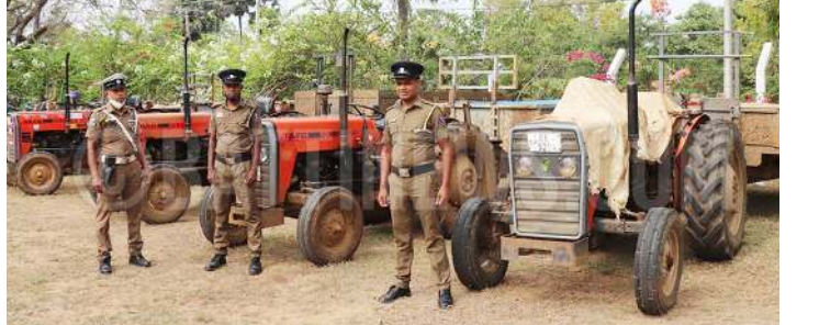
நடவடிக்கையினை முறியடித்துள்ளனர். அனுமதிப்பத்திரம் பெறப்படாமல் மற்றும் அனுமதிப்பத்திர விதிமுறைகளை மீறியமை ஆகியன இவர்கள் மீதான குற்றச்சாட்டுக்களாகும்.

மட்டக்களப்பு தலைமைக்காரியாலய பொலிஸாரும் வாகரை பொலிஸாரும் இணைந்து இச் சட்டவிரோத