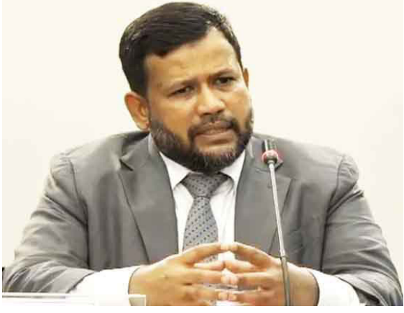
ஜனாதிபதி கோட்டாபய ராஜபக்ஷ ஹிட்லரை போன்று ஆட்சியை முன்னெடுக்க வேண்டும் என்பதே, அவருக்கு வாக்களித்த 69 லட்சம் மக்களின் எதிர்பார்ப்பு என

இராஜாங்க அமைச்சர் திலும் அமுனுகம அண்மையில் வெளியிட்ட கருத்து தொடர்பில், அகில இலங்கை மக்கள் காங்கிரஸ் தலைவரும் நாடாளுமன்ற உறுப்பினரும் ருமான ரிஷாத் பதியதீன் டுவிட்டர் பதிவொன்றை பதிவிட்டுள்ளார்.