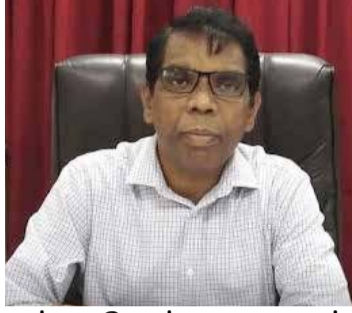
ஒன்றுகூடுவதற்கான தடைகள் மேலும் ஒரு வாரத்துக்கு நீடிக்கப்பட்டுள்ளன என்றும் அவர் தெரிவித்தார். (ஐ-3)

சுகாதார மருத்துவ அதிகாரிகள் பிரிவுகளில் கொரோனா தொற்றுப் பரவல் அதிகரித்தமையால் யாழ். கல்வி வலயப் பாடசாலைகள் மூடப்பட்டன. இந்நிலையில், நாடு முழுவதும் எதிர்வரும் திங்கட்கிழமை நாட்டின் அனைத்துப் பாடசாலைகளும் ஆரம்பமாகும் நிலையில், அன்றைய தினம் யாழ். வலயப் பாடசாலைகளும் ஆரம்பிக்கப்படவுள்ளன. பாடசாலைகள் தவிர, திருமண மண்டபங்கள், மக்கள்