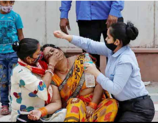
இந்தியாவில் கொரோனா மரணம் உச்சம்: