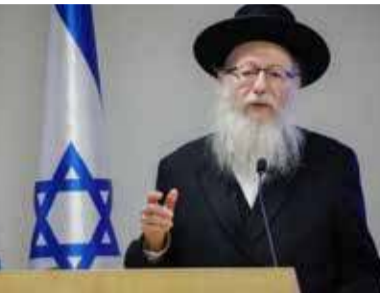
முகக்கவசம் அணிந்து கொள்ள வேண்டும். வரும் ஞாயிறு முதல் இஸ்ரேலில் பொது இடங்களில் மக்கள் முகக்கவசங்கள் அணிந்து கொள்ளத் தேவையில்லை” என்று தெரிவித்துள்ளார். (ஐ)

முகக்கவசம் அணிந்து கொள்ள வேண்டும். வரும் ஞாயிறு முதல் இஸ்ரேலில் பொது இடங்களில் மக்கள் முகக்கவசங்கள் அணிந்து கொள்ளத் தேவையில்லை” என்று தெரிவித்துள்ளார். இதேவேளை, ஒட்டுமொத்த மக்களுக்கும் கொரோனா தடுப்பூசிகளை செலுத்துவதை அரசு தீவிரப்படுத்தியுள்ளது. (ஐ)