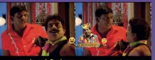
வாங்க தம்பி சம்பள யாருளே நீ...