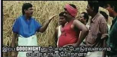
இப்ப GOODNIGHTனு போஸ்ட் போடுவன்லாம் என்ன தரங்க போறான்.

கேட்டியா Man நீ, அதான் உனக்கு பைத்தியம் பிடிச்சி போச்சி..!!!