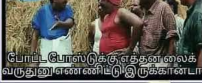
போட்ட போஸ்ட்டுக்கு எத்தனை லைக் வருதுனு எண்ணிட்டு இருக்கான்லாம்