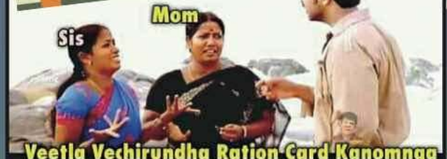
Veetla Vechirundha Ration Card Kanomnga

வாய்விட்டு சிரிங்க...ப்ளீஸ்... மனைவி:- எங்கிட்ட உங்களுக்கு புடிச்சது என்ன? அழகான முகமா!!! அன்பான மனமா!!! பணிவான குணமா!!! கணவன்:- உன்னோட கீழ்க் காசெழுந்தாங்கு