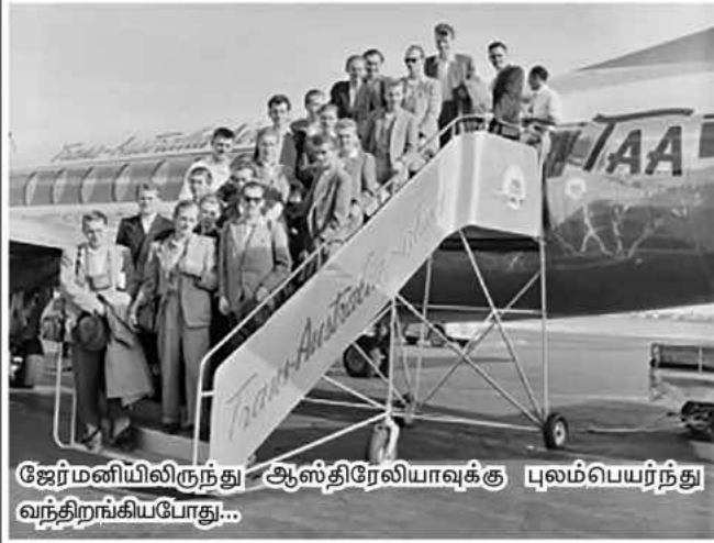
ஜேர்மனியிலிருந்து ஆஸ்திரேலியாவுக்கு புலம்பெயர்ந்து வந்திருக்கிறார்கள்...

யுன்னொரு காலத்திலே, 'வீட்டிலிருந்து வேலை செய்யப் போகிறேன்' என்று ஒருவர் சொன்னால், 'முற்றத்தில் புல் வெட்டப் போகிறார்' என்று மனதுக்குள் மற்றவர்கள் நினைப்பதுண்டு. ஆனால், கொள்ளை நோய் ஒன்று வந்து நம்மையெல்லாம் ஆட்டிப் படைத்தபோது, வீட்டிலிருந்து வேலை செய்வது அனேகமானவர்களுக்கு நியதி என்றாகிவிட்டது.