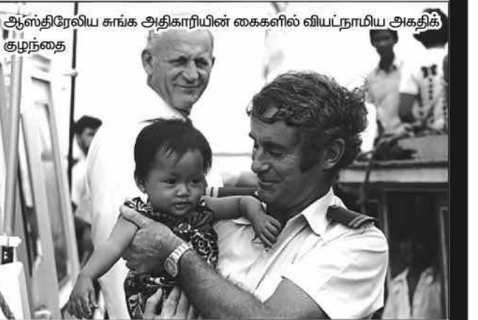
ஆஸ்திரேலிய கங்க அதிகாரியின் கைகளில் வியட்நாமிய அகதிர் குழந்தை

தொற்று நோயின் விளைவாக, நாட்டை விட்டு வெளியேறிய 'திறமை' சாலிகள் நாடு திரும்பாவிட்டால் ஆஸ்திரேலியாவின் பொருளாதார மீட்சி கடுமையாகத்