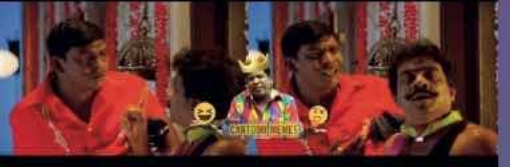
நானும் உன்ன மாறி தான் போன லாக் டவுன்ல சம்பளம் போடுவாங்கன்னு ஏமாந்தவன்...

“வாழ்க்கையின் மிகப் பெரிய சந்தர்ப்பம் எது?” “மனைவியின் கன்னத்தில் கொசு உட்காருவது.”