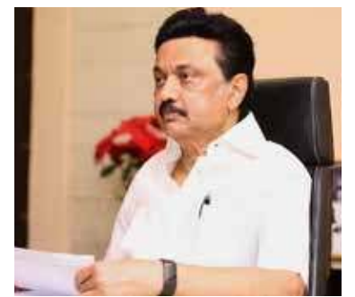
கையில் ஸ்டாலின் குறிப்பிட்டுள்ளார்.

அரசு மருத்துவமனைகளைப் போலவே, தனியார் மருத்துவமனைகளையும் கொரோனா சிகிச்சைக்காகத் தயார் நிலையில் வைத்திருக்க வேண்டும். கொரோனா பரவாமல் தடுப்பது, பாதிக்கப்பட்டவர்களைக் காப்பது, வாழ்வாதாரம் பாதிக்கப்பட்டவர்களுக்கு உதவுவது ஆகிய மூன்றையும் முக்கிய கடமைகளாகக் கொண்டு அரசுகள் செயல்பட வேண்டும்' என தனது அறிக்கையில் ஸ்டாலின் குறிப்பிட்டுள்ளார்.