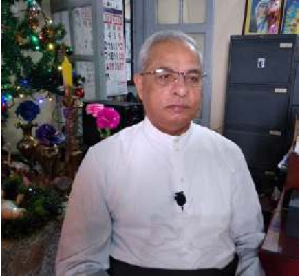
கொழும்பு, ஏப். 21