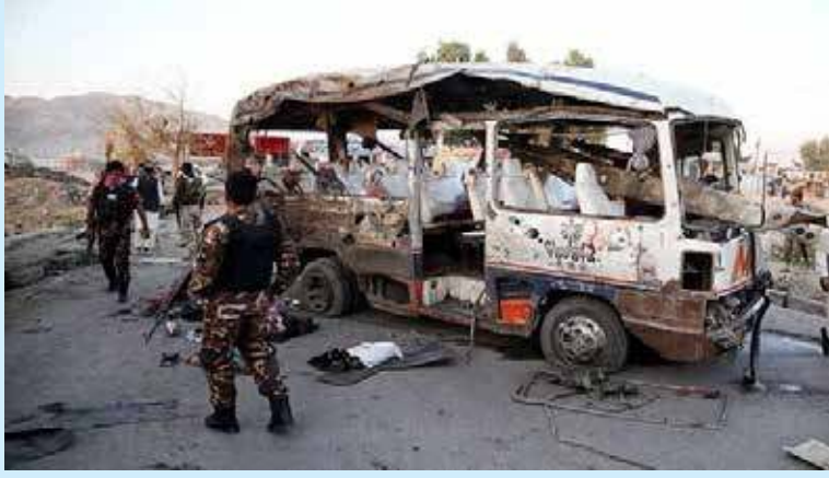
ஆப்கானிஸ்தானில் தலிபான்களின் கொட்டம் இன்னும் அடங்கவில்லை. ஒரு பக்கம் பேச்சுக்கள்,

மற்றொரு பக்கம் வன்முறை என்பது அவர்களின் வழக்கமாக உள்ளது.