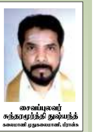
சைவப்புவர் நற்கார்த்தி துஷ்யந்த் வெள்ளி மதுவையன், பிராக்

1978ம் ஆண்டு வீசிய சூறாவளியில் இக்கிராமம் முழுவதும் அழிவுற, இத்தலம் மட்டும் அழியாத ஆற்றலைப் பெற்றிருந்தது. பேசமுடியாதவர்களை பேசவைக்கும் மகிமை பெற்ற தலமாகவும், வாதம், மலடு, குருடு, செவிடு முதலிய குறைகளைப் போக்கி தன்னை நாடிவரும் பக்தர்களுக்கு அற்புதங்கள் புரிந்து அருள் புரியும் மூர்த்தியாக புகழ்பெற்று விளங்குகின்றார். இதனாலேயே அடியவர்கள் நேர்கடன்கள் அதிகரித்துக்கொண்டு வருவதை அவதானிக்க முடிகின்றது. இத்தலத்தின் வரலாறு பற்றி அறிய உதவும் இலங்கியங்களுள் “கருவை நகர் கருதேவாலயக் கல்வெட்டு” முதன்மையானதாக விளங்குகின்றது. அத்தோடு இப்பிரதேச அடியவர்களும் பல பத்திப் பாடல்களைப் பாடியுள்ளனர். அவற்றுள் கருதாவளை சுயம்பு பிள்ளையார், திருப்பொன்னூஞ்சல், காவடிப்பாடல்கள், அருள்பாமாலைகள், என்பன குறிப்பிடத்தக்கனவாகும். இத்தலம் கிராமியக் கலையின் வளர்ச்சிக்கும், சமூக அபிவிருத்திப் பணிக்கும் முக்கிய பங்காற்றிவரும் சமூக நிறுவனமாகவும் செயற்பட்டு வருகின்றது.