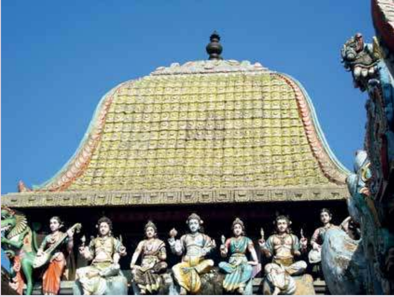
அமைவிடம்: மயிலாடுதுறை மாவட்டம் - தமிழ்நாடு

தேவாரப் பாடல்களில் திருபுள்ளிருக்குவேளூர் என்று குறிப்பிடப்பட்ட சிவத்தலம் தற்போது வைத்தீசுவரன் கோவில் என்று வழங்கப்படுகிறது. சீர்காழியில் இருந்து சுமார் 8 கி. மீ. தொலைவில் உள்ளது. மயிலாடுதுறை, சீர்காழி, கும்பகோணம் மற்றும் தமிழ்நாட்டின் பல முக்கிய ஊர்களில் இருந்து வைத்தீசுவரன் கோவிலுக்கு பேருந்து வசதிகள் இருக்கின்றன. ஒன்பான் கோள்த் (நவக்கிரக) தலங்களில் வைத்தீசுவரன் கோவில் செவ்வாய்த் தலமாக விளங்குகிறது.