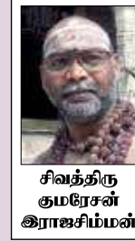
சிவத்திரு குமரேசன் இராஜசிம்மன்

வைத்தியநாதருக்கும், தையல்நாயகிக்கும் செல்லப் பிள்ளையாதலால், இங்குள்ள முருகன் "செல்வ முத்துக்குமாரர்" என அழைக்கப்படுகிறார். முருகன், தூரண அழிப்பதற்காக இத்தல இறைவனைப் பூசித்து வரம் பெற்றுள்ளார். செல்வமுத்துக்குமாரர் சன்னதியில் தினமும் நடக்கும் நள்ளிரவு பூசையின் போது புனுகு, பச்சைக்கற்பூரம், சந்தனம், எலுமிச்சை, பன்னீர், பூ, பால்சாதம், பால் ஆகியவற்றுடன் சிறப்புப் பூசை செய்யப்படும். முருகன் திருவடியில் சாத்தப்படும் சந்தனத்தை வாங்கி சாப்பிட்டால் குழந்தை பாக்கியம் உண்டாகும். முருகனுக்கு முக்கியத்துவம் உள்ள தலம் என்பதால், இங்கு அனைத்து விழாக்களும் முத்துக்குமார சுவாமிக்கு தான். தினமும் காலையிலும், நள்ளிரவு பூசையின் போதும் முதலில் முருகனுக்கு பூசை செய்த பிறகே, சிவனுக்கும் அம்மனுக்கும் பூசை நடக்கும். முத்துக்குமாசுவாமிக்கு தைமாதம் செவ்வாய்கிழமை ஆரம்பித்து 10 நாள் விழா நடக்கும். பங்குனித் திருவிழா 28 நாள் நடைபெறும். இங்கே