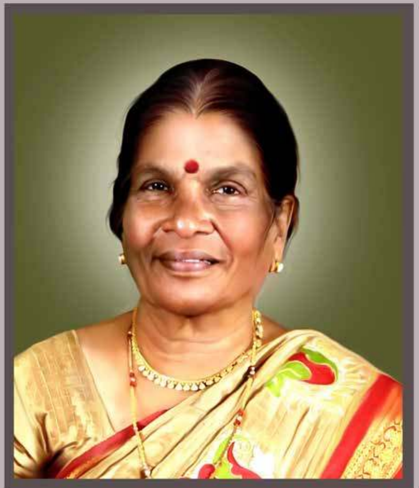
தெய்வத்திருமதி சீவநேசரத்தினம் குணரத்தினம் சத்தரைத் திங்கள் வளர்ப்பறை பதிந்நிருமைப் பிறைநாள்