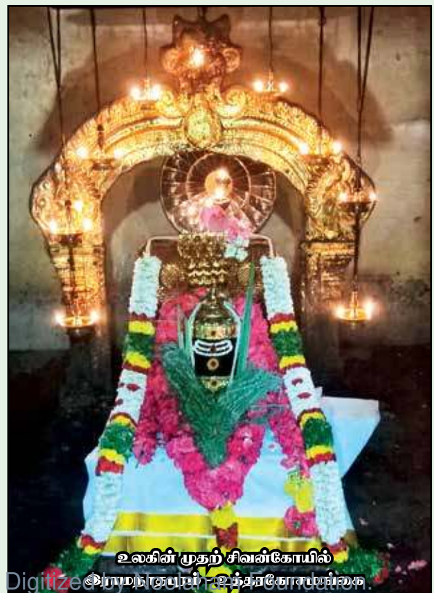
உலகின் முதற் சிவன்கோயில்

இறைவன் விரும்புவது தூய உள்ளத்தையே எனக் கூறுகின்றார். மனக் கோயிலில் எழுந்தருளியவன் அருளும் பாலிக்க வேண்டுமன்றோ? அம்மனிதனை பக்குவப்படுத்தி கடைத்தேற்றி அங்கேயே இரண்டறக் கலந்து நிலைப்பான். இவ்வாறு வாதவூர் மனதுட் பிரவேசித்து அவருடலை இடமாகக் கொண்டு இறைவன் எழுந்தருள்பாலிக்கின்றான் என பறைசாற்றி செல்கின்றார். அதனை அம்மானையிலே