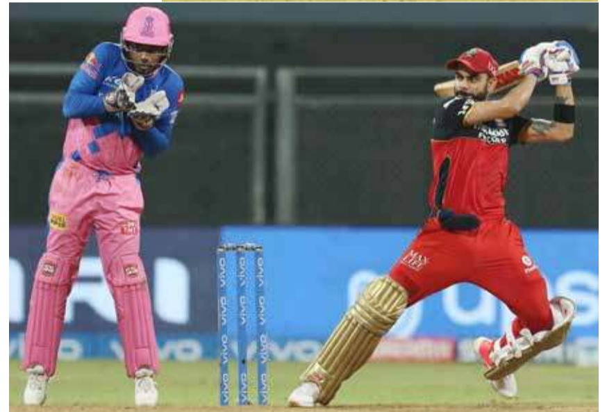
ஆட்டநாயகனாக சதம் அடித்து அசத்திய தேவதத் படிக்கல் தெரிவானார். (ஐ)