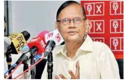
பரவல் தீவிரமடைந்துள்ள நிலையில் இந்தத் தீர்மானம் எடுக்கப்பட்டுள்ளது எனவும் அவர் மேலும் கூறினார்.

இன்று காலை நாடாளுமன்றத்தில் வைத்து அவர் இதனைக் கூறினார். எதிர்வரும் இரு வாரங்களுக்குப் பல்கலைக்கழகங்களைத் திறப்பதை ஒத்திவைத்துள்ளதாகவும் அவர் கூறினார். நாட்டில் கடந்த இரு மாதங்களின் பின்னர் மீண்டும் கொரோனா தொற்று