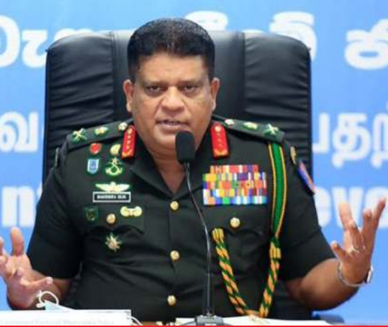
இலங்கையில் மீண்டும் கொரோனா வைரஸின் அபாயம் ஏற்பட்டுள்ளது. இரண்டு மாதங்களுக்குப் பின்னர் தொற்றாளர்களின்