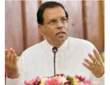
யிட்டிருக்கின்றன. இது மக்கள் மத்தியில் குழப்பத்தை ஏற்படுத்தியுள்ளது. எனினும், அரசு எடுத்த இந்தத் தீர்மானத்தை சவாலுக்கு உட்படுத்த விரும்பவில்லை - என்றார்.

அரசின் இந்தத் தீர்மானத்தின் பிரகாரம் அரசுக்குள் கருத்து வேறுபாடுகள் நிலவுகின்றன என்று எதிரணியினரும், ஊடகங்களும் செய்திகளை வெளியிட்டிருக்கின்றன. இது மக்கள் மத்தியில் குழப்பத்தை ஏற்படுத்தியுள்ளது. எனினும், அரசு எடுத்த இந்தத் தீர்மானத்தை சவாலுக்கு உட்படுத்த விரும்பவில்லை - என்றார்.