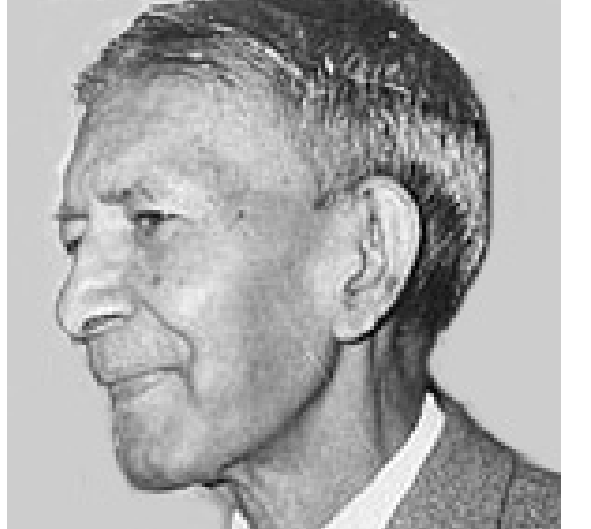
தடையாகும் என்றெல்லாம் பேசப்பட்டது. ஆனால் தந்தை அத்தேர்தலில் போட்டியிட்ட வேட்பாளரைப் பெருவெற்றி கொண்டார்.

1972இல் புதிய இலங்கை குடியரசு அரசியல் யாப்பினை நிராகரித்து நாடாளுமன்றப் பதவியை துறந்தார் தந்தை செல்வா. பின்னர் ஏற்பட்ட காங்கேசன்துறைத்தொகுதி இடைத்தேர்தலில் புதிய யாப்பினை தமிழ் மக்கள் நிராகரிக்கும் ஒரு கருத்துக்கணிப்பாக வைத்து தேர்தலில் போட்டியிட்டார். அவ்வேளையில் அவரது தேர்தல் பிரசாரம் ஒரு பிரசித்தமான இந்துக் கோவிலில்தான் ஆரம்பமானது. அவ்வேளையில் இந்து சமயச் சடங்குளுடன் கொடுக்கப்பட்ட பிரசாதத்தை நான் ஒரு கிறிஸ்தவன், இதை பெறுவது உங்கள் சமய நம்பிக்கைகளை அவமதிக்கும் ஒரு செயலாகும் என அதைப் பெற மறுத்து, தன்னை ஒரு வேத சாட்சி என்பதை நிரூபித்த அதே வேளையில் எல்லோருக்கும் சமய சுதந்திரம் வேண்டும் என்ற கிறிஸ்தவக் கோட்பாட்டை வெளிப்படுத்தினார். பெரும்பான்மையான இந்துக்களை அவமதித்துவிட்டார், இது இவரது தேர்தல் வெற்றிக்குத்