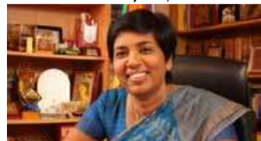
ஜாங்க அமைச்சர் மேலும் தெரிவித்துள்ளார் என சிங்கள உட்கட்சி ஒன்று செய்தி வெளியிட்டுள்ளது.

இதனால் தாம் விரக்தியில் இருக்கிறார் எனவும் அவர் வலியுறுத்தியுள்ளார். எவ்வாறாயினும், கட்சி மாறும் எண்ணம் கிடையாது என இரா