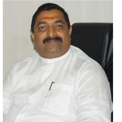
முன்னெடுக்கப்படவில்லை. நாடாளுமன்றத்திற்குள் நுழையும் போது பாதுகாப்புடன் செல்ல வேண்டிய நிலைமை ஏற்பட்டுள்ளது. - என் றார்.

கொவிட் கட்டுப்படுத்தலுக்காக பெருந்தோட்டங்களில் எந்தவொரு முறையான வேலைத்திட்டங்களும்