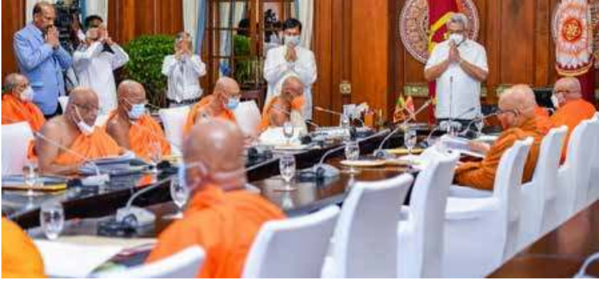
கொழும்பு துறைமுக நகர பொருளா தார ஆணைக்குழு சட்ட மூலம் தொடர்

பில் ஜனாதிபதி கோட்டாபய ராஜபக்ஷ மகா சங்கத்தினருக்குத் தெளிவுபடுத்தியுள்ளார்.