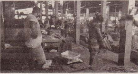
யாழ்ப்பாணம், ஏப்.12 கடந்த இரு வாரங்களாக மூடப்பட்டிருந்த திருநெல்வேலி பொதுச் சந்தைத் தொகுதி மற்றும் கடைகள் நேற்று மீளத் திறக்கப்பட்டன. பி.சி.ஆர். பரிசோதனை செய்து கொண்ட வர்த்தகர்

களே வர்த்தக நடவடிக்கையில் ஈடுபட அனுமதிக்கப்பட்டனர். இந்த நிலையில் பி.சி.ஆர். பரிசோதனை மேற்கொண்ட 55 வர்த்தகர்கள் நேற்று வியாபார நடவடிக்கைகளில் ஈடுபட்டனர். குறித்த பகுதியிலும் கொரோனாத் தொற்றாளர்கள் இனங்காணப்பட்டதை அடுத்து, சந்தைத் தொகுதியும், அந்தப் பகுதி வர்த்தக நிலையங்களும் மூடப்பட்டன. வியாபாரிகள், வர்த்தக நிலைய உரிமையாளர்கள் மற்றும் பணியாளர்கள் தனிமைப்படுத்தப்பட்டிருந்த நிலையில் பி.சி.ஆர். பரிசோதனை மேற்கொண்டவர்கள் வர்த்தக நடவடிக்கைகளில் ஈடுபட முடியும் என்று சுகாதாரப் பிரிவினர் தற்போது அறிவித்துள்ளனர். (எ-20)