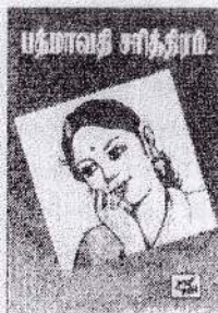
பத்மாவதி சரித்திரம் - அ.மாதவையா

நண்பரே, ஒரு நிமிஷமாவது பிறவித் துன்பங்களை மறந்து தேகபரவசமாகி, நிஷ்களங்கமான சந்தோஷத்தை அனுபவிக்க நீர் விரும்பினால் உடனே திருக்குற்றாலம் சென்று அவ்வருவிக் காட்சியைக் கண்படைத்த செல்வமென்றோக்கும். அப்போதும் உம் மனக்கவலை மாறாவிடின் பொங்குமாந் கடலினிற்றும் அருவிபுடன் தலைகீழாகத் துள்ளி விழுந்து உயிரை விடுதலே உத்தமம்.