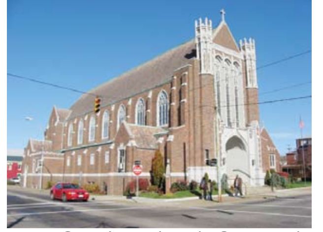
தூய ஜோன் லூத்தரன் பேராலயம்

இறுதியாக ஓர் ஆலயத்தின் திருநிலைப்பாட்டு விழா நாமும் இறைவனுக்கு உகந்த ஆலயமாக இருக்கிறோம் என்பதை நமக்கு உணர்த்துகிறது. எனவே நமது உடலையும் உள்ளத்தையும் எப்பொழுதும் தாய்மையானதாக வைத்திருக்கும்போது இறைவன் நம்முள் வசிக்கிறார். திருமுலர் சொல்வது போல நாம் அனைவரும் 'நடமாடும் ஆலயம்' ஆகிறோம். இந்த உண்மையை நம்மிடம் கேள்வி கேட்பதன் மூலம் உணர்த்துகிறார் திருத்தாதர் பவுல்.