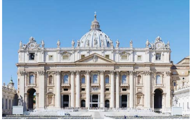
தூய பேதுரு பேராலயம்