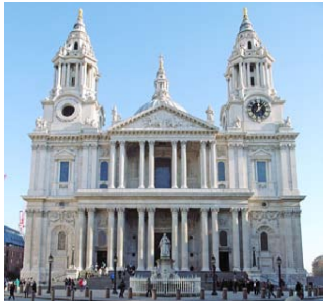
தூய பவுல் பேராலயம்