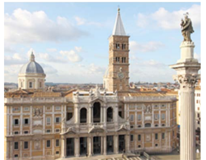
தூய மேரி மேஜர் பேராலயம்

"நீங்கள் கடவுளுடைய கோவில் என்றும், கடவுளின் ஆவி உங்களுள் குடியிருக்கிறார் என்றும் உங்களுக்குத் தெரியாதா? (1கொரி. 3:16).