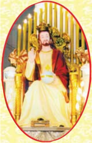
உமது இராட்சியம் வருக