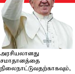
அரசியலானது சமாதானத்தை நிலைநாட்டுவதற்காகவும்,

பாதுகாப்புக்கும் மற்றும் நிர்வாகத்திற்கும் பொறுப்பானவர்கள் அதற்காக கடமையுணர்வுடன் கட்டாயமாக செயற்பட வேண்டுமெனவும் திருத்தந்தை பிரான்சிஸ் அவர்கள் தெரிவித்தார்.