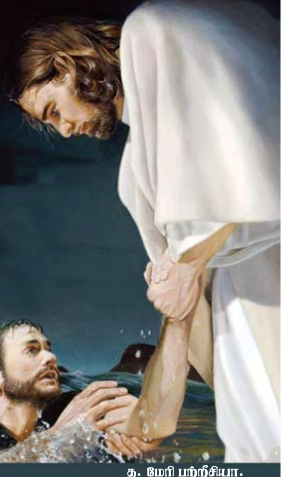
த. மோரி பற்றிசியா.

எனவே மனிதர்களின் புறத்தோற்றம், உடை, பதவி, குடும்ப சூழல், பணம், அந்தஸ்து, பட்டம் வசதவாய்ப்பு, படைக்கப்பட்டிருக்கும் ஒவ்வொருவரையும் இதயங்களில் இருக்கும் காயங்கள், தவிப்புக்கள், சோர்வு இவற்றை வெளிப்படுத்தும் முகங்களின் கண்களில் தெரியும் பாஷைகளை புரிந்து ஏக்கங்களை அறிந்து, உணர்வுகளின் வகைகளை வாசித்து, பரிவோடு அரவணைத்து, அவர்களின் இதயங்களோடு பேசி, மகிழ்ச்சி, விடுதலை, புகழுவார்வு, புகழுவாழ்வு இவற்றை நாமும் சுவைத்து நாம் உறவாடும் உறவுகளும், இதயங்களும் அவற்றை அனுபவித்து வாழ முயல்வோமாக.