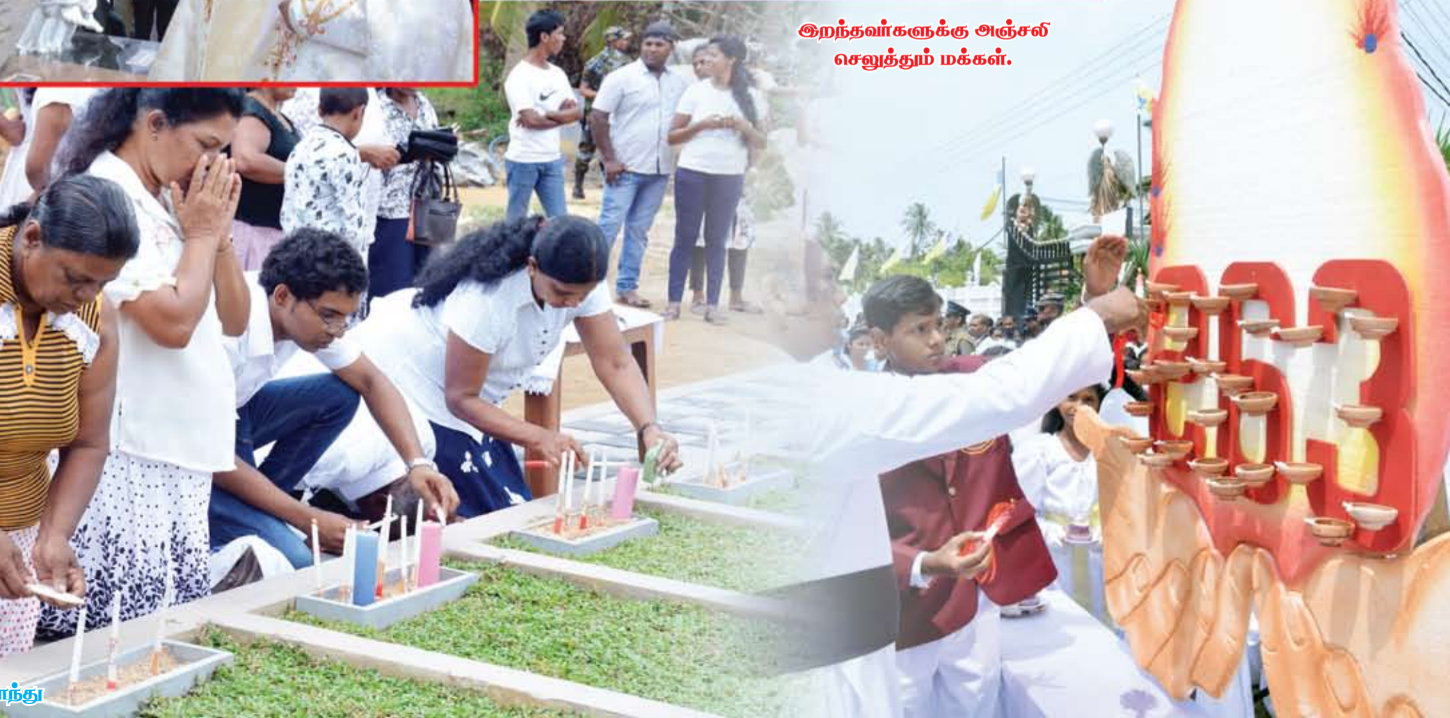
இறந்தவர்களுக்கு அஞ்சல் செலுத்தும் மக்கள்.