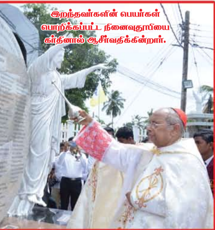
இறந்தவர்களின் பெயர்கள் பொறிக்கப்பட்ட நனைவூதியை கர்தினால் ஆசீர்வதிக்கின்றார்.