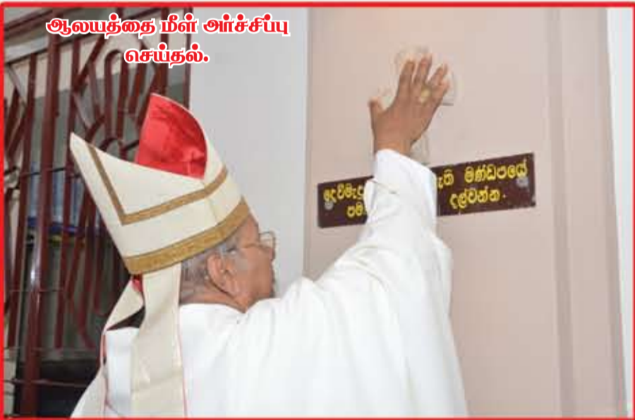
ஆலயத்தை மீள் அர்ச்சிப்பு செய்தல்.