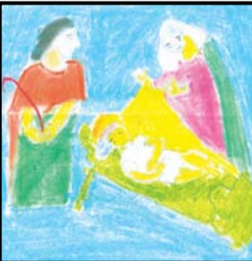
டி.கிளாஸி - தரம் 6 கொ / விபுலாநந்தா த/மகா வித்தியாலயம்