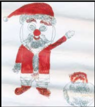
எஸ் விபுசனி - தரம் 6 கொ / விபுலாநந்தா த/மகா வித்தியாலயம்