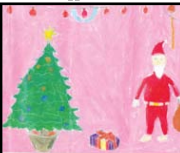
பு. அபிநயன் - தரம் 6 கொ / விபுலாநந்தா த/மகா வித்தியாலயம்