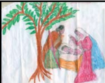
ஷலோமி - தரம் 6 கொ / விபுலாநந்தா த/மகா வித்தியாலயம்