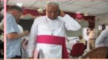
மன்னாரில் 2014ஆம் ஆண்டு ஓகஸ்ட் மாதம் இடம்பெற்ற காணாமலாக்கப்பட்டவர்கள் தொடர்பான இணைநிலை ஆணைக்குழு அமர்வில் ஈடுபட்ட மறைமாவட்ட ஆயர் மேதகு இரா யோசேப்யு ஆண்டகையின் தலைமையில் நடைபெற்ற சிறப்பு பொழிவு.