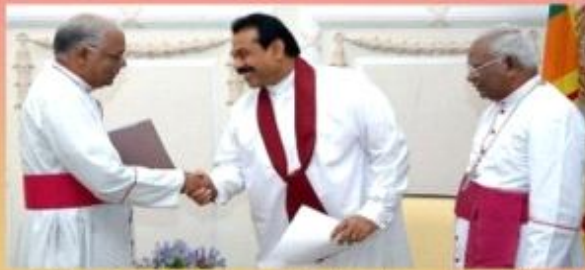
2006 மே 30ஆம் திகதி யாழ் ஆயர் தோமஸ் ஆண்டகையின் அவர்தரிசுவையில் ஜனாதிபதி மந்திர ராஜபக்ச அவர்களைச் சந்தித்து மக்களின் நிலைமைகளை விளக்கியபோது.