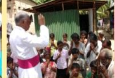
2007ஆம் ஆண்டு ஜூன் 2ஆம் திகதி மன்னார் இடம்பெற்ற மறைமாவட்ட ஆயர் மேதகு இரா யோசேப்யு ஆண்டகையின் தலைமையில் நடைபெற்ற சிறப்பு பொழிவு.