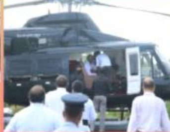
2015ஆம் ஆண்டு ஜனவரி 9ஆம் திகதி அன்று சிங்களவில் சிங்களப் பெற்ற பின்னர், கொழும்பு விமான நிலையத்திலிருந்து உடனடியானவாழ் விழாக்கத் தள்ளிய இராஜபக முகாமிற்கு அருகாமையில் தரையிறவி மன்னாள் வந்தடை த்தார்.