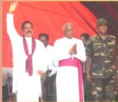
2010 ஜனவரி 9ஆம் திகதி அன்று 700 இந்துக் குடும்பங்கள் முன்னால் விடுதலைப் புலி உறுப்பினர்கள் தம் குடும்பங்களோடு இணைக்கப்பட்டபோது.