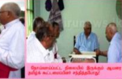
மறைமாவட்ட நினைவில் இருந்த ஆயர் மேதகு இரா யோசேப்யு ஆண்டகையின் தலைமையில் நடைபெற்ற சிறப்பு பொழிவு.