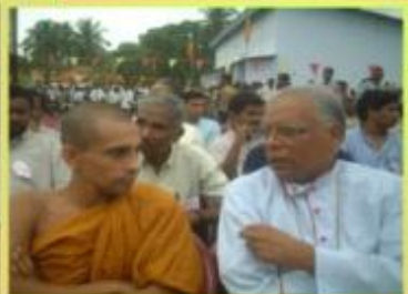
பொந்துவழி நிஷ்டையில் கலந்துகொண்ட பொந்த மதத் துறையினர் அணவராவிய போதையின்.