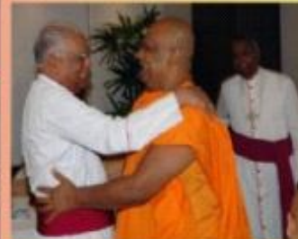
நல்லினக்கம் தொடர்பான கலந்துரையின் பின்னொருக்க உயர்ந்த பொந்த ஊழியை ஆரத்தலில் உடனடியாய்ப்போது.