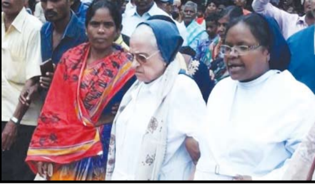
பழங்குடியினரிடையே சேவையாற்றிய இன்பானிய அருள்சகோதரியை 10 நாட்களுக்குள் நாட்டை விட்டு வெளியேற்றும் உத்தரவிட்டது இந்திய அரசு