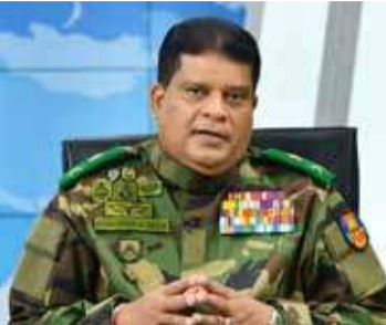
துறையில் நீங்கள் குறிப்பிடும் விடயம் தொடர்பில் ஆராய்ந்து பார்க்கின்றேன் - என்றார். (அ)

இராணுவத் தளபதி கூறுகிறார் கொழும்பு, ஏப். 28 மக்களிடம் ஒப்படைக்கப்பட்ட காணிகளை மீண்டும் சவீகரிக்கும் நோக்கம் எமக்கு இல்லை. ஆனால், நீங்கள் குறிப்பிடும் விடயம் தொடர்பில் ஆராய்கின்றேன் என இராணுவத் தளபதி ஜெனரல் சவேந்திர சில்வா ஊடகங்களிடம் தெரிவித்தார். நல்லாட்சி அரசின் காலத்தில் காங்கேசன்துறையில் விடுவிக்கப்பட்ட தனியார் காணிகளை இராணுவத்தினர் மீளக்கையகப்படுத்துவது தொடர்பில் கேட்டபோதே அவர் மேற்கண்டவாறு கூறினார். அவர் மேலும் தெரிவித்ததாவது:- மக்களிடம் ஒப்படைக்கப்பட்ட காணிகளை நாம் மீள ஆக்கிரமிக்கவில்லை. அவற்றைச் சவீகரிக்கும் நோக்கமும் எமக்கு இல்லை. காங்கேசன்