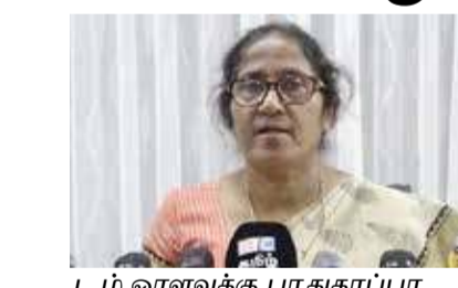
டம் ஓரளவுக்கு பாதுகாப்பாகவே உள்ளது. இருப்பினும் சுகாதார நடைமுறைகளை பின்பற்றி பொது மக்கள் நடந்து கொள்ளவதோடு, சுகாதார துறையின் ஆலோசனைகளின் படியும் செயற்பாடுகளை முன்னெடுத்து வருகின்றோம் - என்றார்.

கிளிநொச்சி மாவட்டத்தில் எழுந்தமானதாக மேற்கொள்ளப்படுகின்ற பி.சி.ஆர். பரிசோதனைகளில் கிடைக்கப் பெறுகின்ற முடிவுகளின்படி மாவட்டத்தைச் சேர்ந்த எவருக்கும் தொற்று ஏற்பட்டுள்ளதாக இல்லை. வெளி மாவட்டங்களிலிருந்து வருகின்றவர்களே தொற்று ஏற்பட்டுள்ளது. எனவே, மாவட்ட