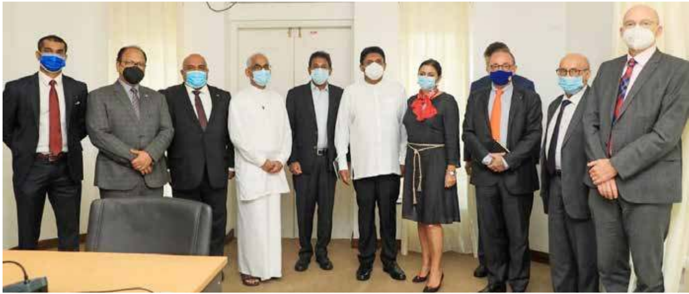
மிக மோசமான நிலையில் இலங்கை