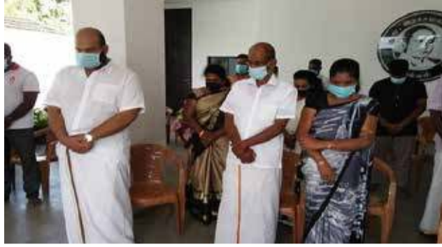
நாடாளுமன்ற உறுப்பினராகவும் இளைஞராகவும் தொடர்ந்து போராடுவேன் என்றும் அவர் மேலும் தெரிவித்தார்.

தமிழ் மக்களுக்கான அரசியல் உரிமை கிடைக்கும் வரையில் தமிழ் மக்களின் உரிமைக்காக