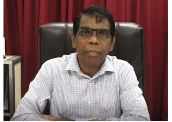
உட்படுத்தியுள்ளது. அத்தகையதொரு நிலைமை யாழ்ப்பாணத்திலும் ஏற்படுமாயின் முடக்குவது தொடர்பான தீர்மானம் எடுக்கப்படலாம். - என அவர் குறிப்பிட்டுள்ளார்.

தொற்று யாழ்ப்பாணத்தில் உறுதி செய்யப்பட்டுள்ளது. இதில் 708 பேர் குணமடைந்து வீடு திரும்பியுள்ளனர். இதுவரை 19 பேர் குறித்த தொற்றால் உயிரிழந்துள்ளனர். அத்துடன் நேற்று வரை ஆயிரத்து 253 குடும்பங்களைச் சேர்ந்த 3,416 பேர், சுய தனிமைப்படுத்தலுக்கு உட்படுத்தப்பட்டுள்ளனர். ஆகவே சுகாதார நடைமுறைகளைப் பொதுமக்கள், அரசு தனியார் துறை நிறுவனங்கள் உள்ளிட்ட அனைவரும் கடைப்பிடித்து, தங்களது செயற்பாடுகளை முன்னெடுக்க வேண்டும். மேலும் தற்போதைய சூழ்நிலையில் யாழ்ப்பாணத்தை முடக்குவது தொடர்பாக தீர்மானம் இல்லை. ஆனாலும் அரசாங்கம், கொரோனா அச்சுறுத்தல் அதிகம் காணப்படும் மாவட்டங்களிலுள்ள சில கிராம உத்தியோகத்தர் பிரிவுகளை சுய தனிமைப்படுத்தலுக்கு