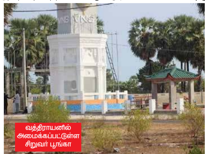
வத்திராயனில் அமைக்கப்பட்டுள்ள சிறுவர் பூங்கா

ஏனெனில் எமது மண்ணை நாம் தாரை வார்த்த வில்லை என்னும் பெயரில் கடல் வளத்தை அழித்து, தீவு அமைத்து, அந்தப் பகுதியை சீனாவிற்கு தாரை வார்த்தும் அரசுக்கு எதிராக அந்த அரசை வாக்களித்துத் தெரிவு செய்த தாம் குரல் எழுப்ப முடியாமல் உள்ளனர்.