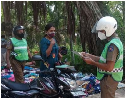
முறையில் பின்பற்ற தவறியவர்களுக்கு எதிராக பொலிஸாரால் பெயர் விவரங்களை எழுதிய பின்னர் எச்சரிக்கையுடன் விடுவிக்கப்படுகின்றனர்.