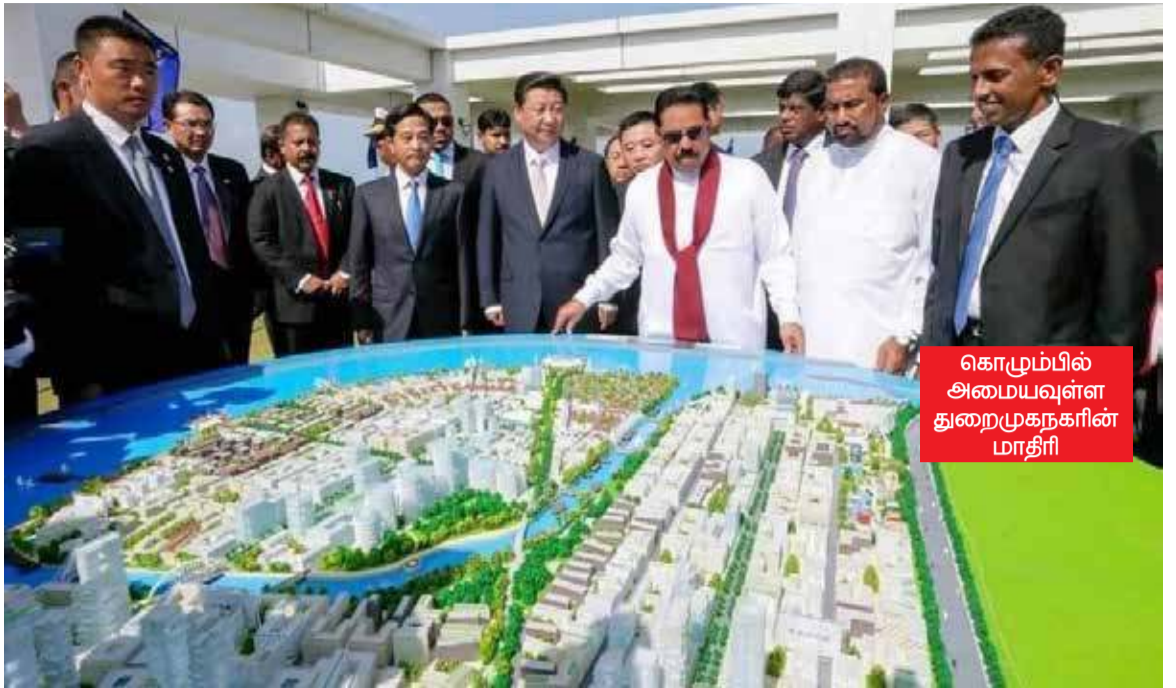
கொழும்பில் அமையவுள்ள துறைமுகநகரின் மாதிரி

7 ஆண்டுகளில் ஒரு தீவை உருவாக்கியுள்ள சீனா