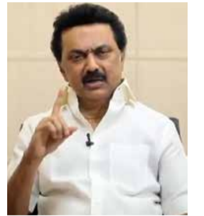
கும் பொறுப்பை மேற்கொள்ள வேண்டும். தமிழகத்திற்கு எவ்வகையிலும் அநீதி இழைத்திடக் கூடாது' எனத் தெரிவித்துள்ளார்.

அதிகரித்துள்ளது. ஒட்சிசன் தேவை இனி வரும் நாட்களில் அதிகரிக்கும். எனவே தமிழகத்தினத் முழு தேவையை நிறைவேற்றிய பின்னர் மீதமுள்ள ஒட்சிசனை பிற மாநிலங்களுக்கு அளித்திடுவதே, சரியான வழிமுறையாகும். ஒட்சிசனை பங்கிடும் பொறுப்பை, மத்திய அரசிடம் உயர்நீதிமன்றம் வழங்கியுள்ளது. எனவே பிரதமர் இதில் கவனம் செலுத்த வேண்டும். குறித்த ஆலையில் உற்பத்தியாகும் ஒட்சிசனை தமிழகத்தின் முழு தேவைக்கு ஏற்ப பகிர்ந்தளிக்க