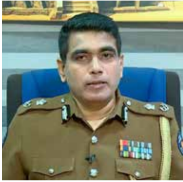
செய்யப்பட்டனர் என பொலிஸ்மா அதிபர் தெரிவித்தனர். 2020 ஆம் ஆண்டு ஒக்ரோபர்

அத்துடன் நேற்றுக்காலை 6 மணியுடன் நிறைவடைந்த கடந்த 24 மணித்தியாலங்களில் மாத்திரம் தனிமைப்படுத்தல் சட்டத்தை மீறிய 145 பேர் கைது செய்யப்பட்டனர் எனவும் அவர் தெரிவித்தார்.