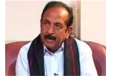
மைக் கோளாறுகளால், ஐந்து ஆண்டுகள் ஆகியும் இன்றுவரை இயக்கப்படாமல் உள்ளது. எனவே, தமிழக அரசு, திருச்சி பெல் ஆலையில், ஒட்சிசன் ஆக்கும் பணிகளை உடனே தொடங்க ஏற்பாடு செய்ய வேண்டும் என வலியுறுத்துகின்றேன் - என்று தெரிவித்துள்ளார்.

மேற்கொள்ளாததால், 2016ஆம் ஆண்டு முதல் நிறுத்தி வைக்கப்பட்டு இருக்கின்றது. அங்கே, 8 மணி நேரத்தில், 1,000 கியூபிக் மீற்றர், அதாவது 150 உருளைகள் ஒட்சிசன் ஆக்கும் திறன் கொண்டது. ஒரு நாளைக்கு மூன்று வேலை நேரங்களில் குறைந்தது 400 உருளைகள் ஒட்சிசன் ஆக்க முடியும். அவ்வாறு கிடைத்த ஒட்சிசன், 2016ஆம் ஆண்டு வரை, திருச்சி பெல் மருத்துவமனையில் பயன்படுத்தப்பட்டு வந்தது. பெல் ஆலையின் மேலாண்