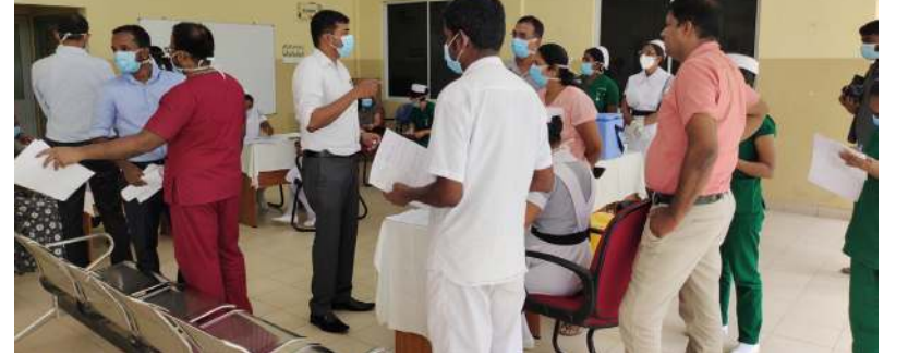
கொண்டவர்களிற்கு இரண்டாவது தடுப்பூசி முதல்கட்டமாக நேற்று செலுத்தப்பட்டிருந்தமை குறிப்பிடத்தக்கதாகும்.

அதற்கு அமைவாக கிளிநொச்சி வைத்தியசாலையில் கடமையாற்றும் வைத்தியர்கள், தாதியர், சுகாதார ஊழியர்களுக்கு இரண்டாவது தடுப்பூசி ஏற்றப்பட்டது. முதலாவது தடுப்பூசி பெற்றுக்