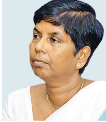
பார்ம் தடுப்பூசியின் பங்குகள் தற்போது இலங்கையில் உள்ளன. அதனை உள்ளூர்வாசிகள் பயன்

இலங்கை இதுவரை அஸ்ட்ரா ஜெனெகா கொவிஷீல்ட் தடுப்பூசியைப் பயன்படுத்தியது. சீன சினோ