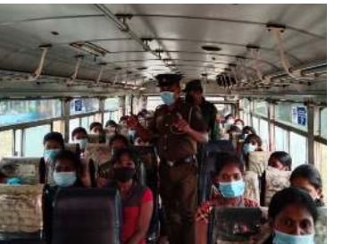
தார நடைமுறைகளைப் பின்பற்றுமாறும் அறிவுறுத்தப்பட்டுள்ளமையும் குறிப்பிடத்தக்கது.

முகக்கவசம் அணிய வேண்டும் என்பதை வலியுறுத்தி மக்களுக்கு விழிப்புணர்வு ஏற்படுத்தி வருகின்றனர். கடந்த செவ்வாய்க்கிழமை தருமபுரம் பொலிஸ்பிரிவில் பல்வேறு பகுதிகளில் விழிப்புணர்வு நடவடிக்கை மேற்கொள்ளப்பட்டது. இதன்போது மக்களை முகக் கவசங்களை அணியுமாறும், சுகா