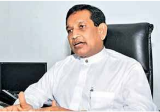
ரிஷாத் பதியுதீன், ரவூப் ஹக்கீம் போன்ற ஜனநாயகவாதிகள் கைது செய்யப்படும்போது, பிரிவினைவாதத் தலைவர்களே எஞ்சியிருப்பார்கள். வடக்கில் அமிர்தலிங்கம் போன்றோரை நாடாளுமன்றில் இருந்து வெளியேற்றியதும், ஜனநாயகவாதிகளுக்கு கருத்து வெளியிட வாய்ப்புகள் இல்லாமல்போனதும், இறுதியில் வேலுப்பிள்ளை பிரபாகரன் துப்பாக்கியுடாக பேசினார். இவ்வாறான ஒரு நிலைமை மீண்டும் நிகழாமல் இருக்கவே நாம் செயற்படுகின்றோம்.

ரிஷாத் பதியுதீன் செய்துள்ள என்ற தொனிப்பொருளில் இந்த ஆர்ப்பாட்டம் இடம்பெற்றது. இதில் பங்கேற்று கருத்து வெளியிடக்கையில் நாடாளுமன்ற உறுப்பினர் ராஜித சேனாரத்ன இந்த விடயத்தை குறிப்பிட்டுள்ளார். ரிஷாத் பதியுதீன் ஏன் கைது செய்யப்பட்டார், அவருக்கு எதிராக ஜனாதிபதி ஆணைக்குழு எவ்வித சாட்சிகளையும் முன்வைக்கவில்லை. அவரை இதற்கு முன்னர் 5 தடவைகள் குற்றப்புலனாய்வுத் துறை கைது செய்து விசாரணைகளை முன்னெடுத்ததோடு அவரை விடுதலை செய்துள்ளது. ரிஷாத் பதியுதீனின் சகோதரர் கைது செய்யப்பட்டு எட்டு மாதங்கள் தடுத்து வைக்கப்பட்டு இறுதியில் அவருக்கும் தாக்குதலுக்கும் எவ்வித தொடர்பும் இல்லை யென பி அறிக்கையைச் சமர்ப்பித்தார்கள். யாருடைய நோக்கத்துக்காகக் கைது செய்யப்படுகின்றார்கள். மேலிடத்திலிருந்து அறிவுறுத்தல் வழங்குவது யார்? ஒவ்வொருத்தர் கோரிக்கை விடுக்கையில் அவர்களை மகிழ்ச்சிப்படுத்துவதற்காக இடம்பெறும் கைதுகள் மனித உரிமை மீறலாகும்.