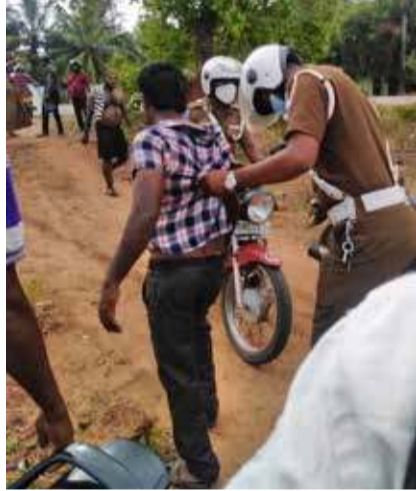
முல்லைத்தீவு, மே 02 முல்லைத்தீவு பொலிஸ் பிரிவிற்கு உட்பட்ட உண்ணாப்புலவு பகுதியில் வாள்கள் மற்றும் பொல்லுகளுடன் தாக்குதல் நடத்த வந்த மூவர் கைது செய்யப்பட்டுள்ளனர்.

குறித்த சந்தேகநபர்கள் மூவரும் கடந்த வியாழக்கிழமை பொலிஸாரிடம் சிக்கியுள்ளனர் எனத் தெரியவருகிறது.