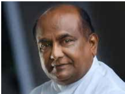
மன்றத்தைக் கூட்டுவதற்கு தீர்மானிக்கப்பட்டிருப்பதாகவும், இதற்கமைய முற்பகல் 9.30 மணிக்கு ரிஷாத்தை நாடாளுமன்ற நுழைவாயிலுக்கு அழைத்து வர நடவடிக்கை எடுக்குமாறும் அதில் குறிப்பிடப்பட்டுள்ளது.