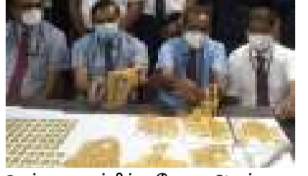
செல்ல முயற்சி செய்த போது அவர் கைது செய்யப்பட்டுள்ளார். தங்கத்தை வெளியில் கொண்டு செல்ல முயற்சி செய்த சந்திகரிப்பு பணியாளரும் கைது செய்யப்பட்டுள்ளார் என சுங்க ஊடகப் பேச்சாளர் கூறினார்.