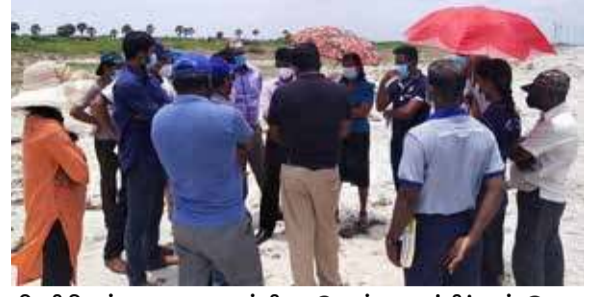
பிரதிநியும் வருகை தந்தி ருந்தார். இதற்கு அண் மையில் உள்ள 137 மீற்றர் கரைவலைப்பாட்டிற்கும் சிறு தொழிலாளர்களின் போக்குவரத்திற்கும் இடை யூறி இன்றியும் சுகாதார முறைப்படியும் அனுமதி வழங்கலாம் எனத் தீர்மா னிக்கப்பட்டுள்ளது.

யல் வளத் திணைக்கள அதிகாரி கள், சுற்றுச் சூழல் பாதுகாப்பு அதி கார சபை ஆகியோருடன் பிரதேச சபையினருடன் சம்பவ இடத்துக்கு நேரில் வருகை தருமாறு கரையோரம் பேணல் மற்றும் கரையோர மூல வள முகாமைத் திணைக்களம் அழைப்பு விடுத்திருந்தனர். இதன்போது மேற்படி திணைக் கள் அதிகாரிகளிற்கு இறால் பண் னை அமைக்க திட்டமிடும் பகுதியை அடையாளப்படுத்த ஆயர் இல்ல