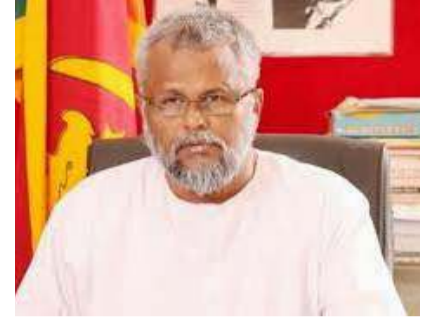
சிறந்த சந்தை வாய்ப்பைப் பெற்றுக் கொடுத்தல் போன்ற முயற்சிகள் தற்போது மேற்கொள்ளப்படுகின்றன. - என்றார்.

தலைமைகள் விவசாயத்தை விருத்தி செய்து வறுமை ஒழிப்பது தொடர்பான சாத்தியங்களைப் பற்றி அக்கறையின்றி செயற்பட்டனர். இதேநேரம் மக்களை உசுப்பேற்றி தவறாக வழிநடத்துவதில் ஆர்வம் செலுத்தியமையே வறுமை நீடிப்பதற்கு காரணம். தற்போது விவசாய நடவடிக்கைகளை விருத்தி செய்வதற்கான ஏதுநிலைகள் தொடர்பாக கவனம் செலுத்துவது மற்றும் கிடைக்கும் அறுவடைகளுக்கு