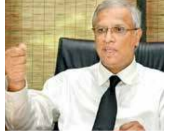
தளத்திலும் தனது உத்தியோகபூர்வ 'டுவிட்டர்' தளத்திலும் சுமந்திரன் எம்.பி. மேற்படி வாழ்த்துச் செய்தியைப் பதிவிட்டுள்ளார்.

தமிழக சட்ட சபைத் தேர்தலில் அமோக வெற்றியீட்டிய தி.மு.க.வுக்கும் தலைவர் மு.க. ஸ்டாலினுக்கும் எமது மனம் நிறைந்த வாழ்த்துகள். - இவ்வாறு தமிழ்த் தேசியக் கூட்டமைப்பின் பேச்சாளரும் யாழ்.மாவட்ட நாடாளுமன்ற உறுப்பினருமான ஜனாதிபதி சட்டத்தரணி எம். ஏ. சுமந்திரன் தெரிவித்துள்ளார். தமிழ்த் தேசியக் கூட்டமைப்பின் உத்தியோகபூர்வ 'டுவிட்டர்'