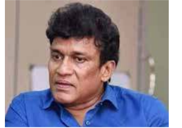
தமிழக உடன் பிறப்புகள் தரும் ஜனநாயக முடிவுகளை ஏற்று அதை எப்படி எமக்கு பயனுள்ளதாக மாற்றிக்கொள்ள முடியும் என்பதை மட்டுமே, இலங்கையில் நாம் கணிக்க வேண்டும்.